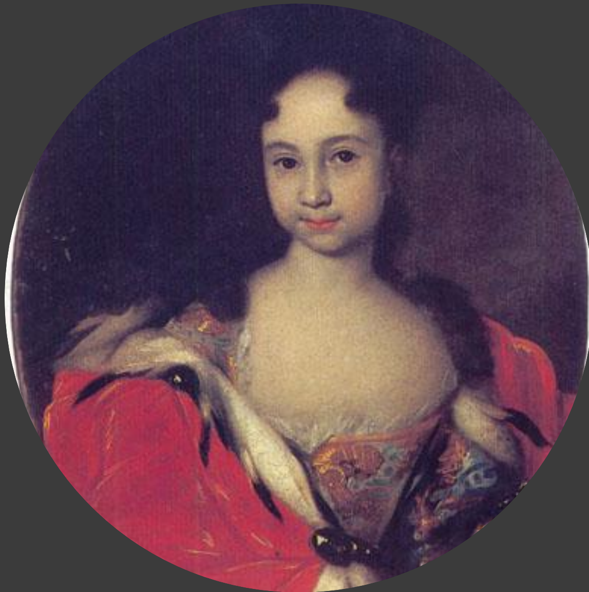
Нестеров П.Н., Анна Петровна в Детстве