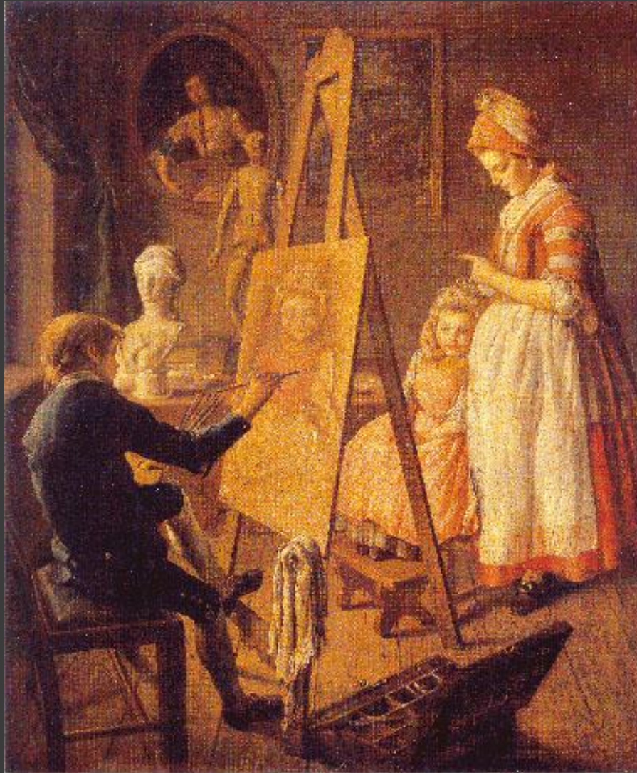
Фирсов «Юный художник»

http://www.ynpress.ru/c/hild-art/img/013.jpg