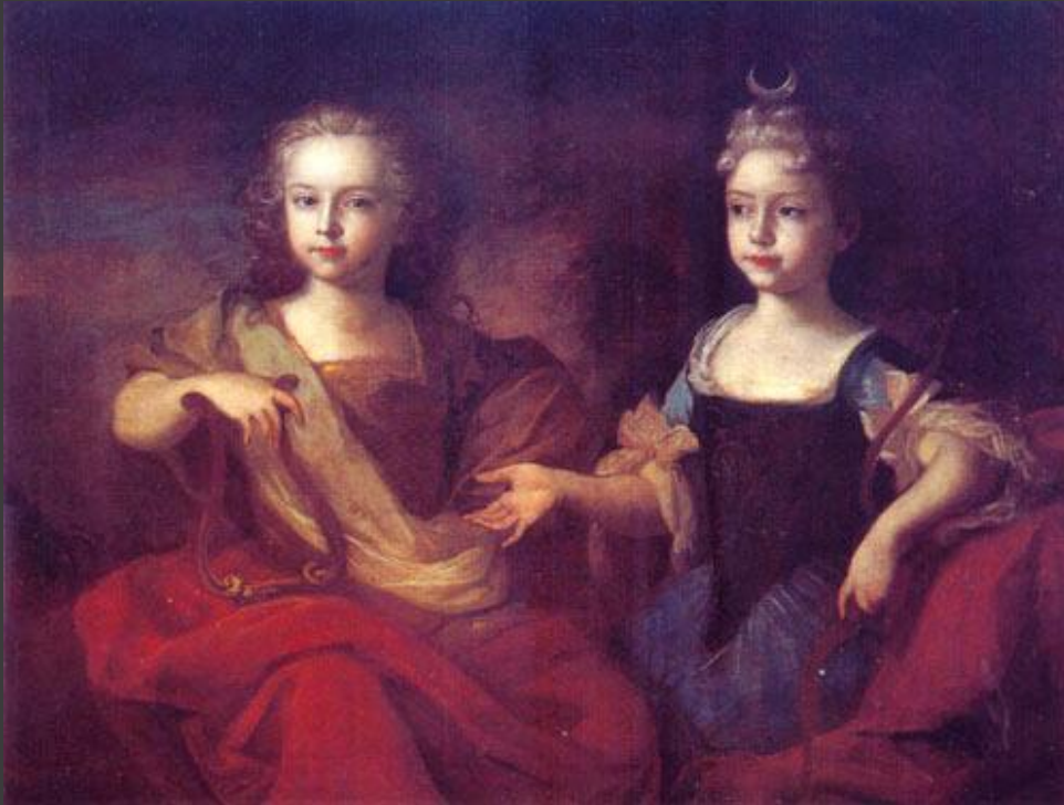
Французский художник Луи Каравакк: ПОРТРЕТ В КАРНАВАЛЬНЫХ КОСТЮМАХ внуков Петра