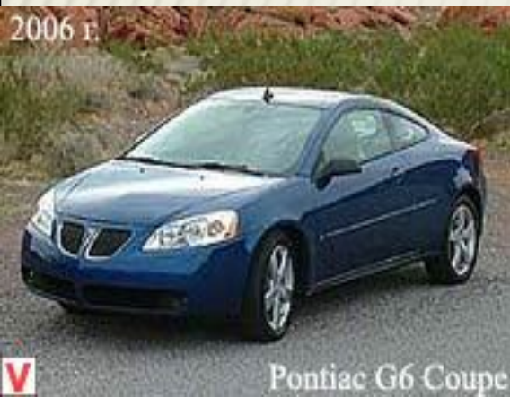
Pontiac G6 Coupe