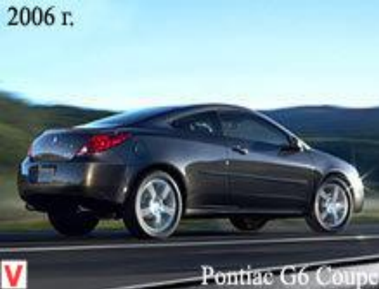
Pontiac G6 Coupe