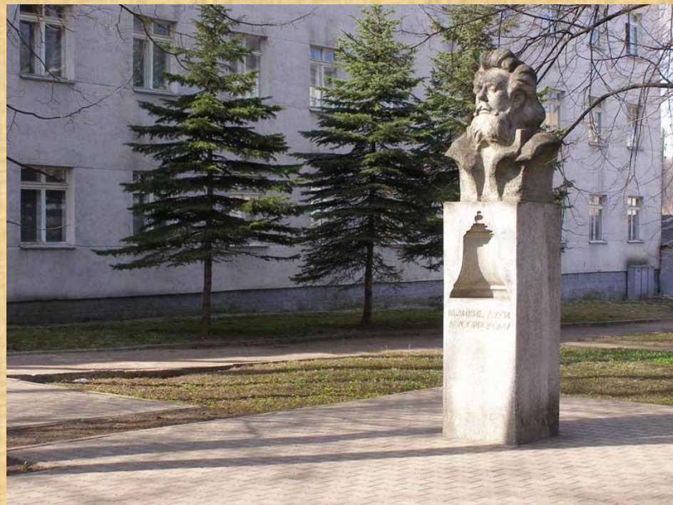
Памятник М.П. Мусоргскому возле музыкальной школы г. Великие Луки