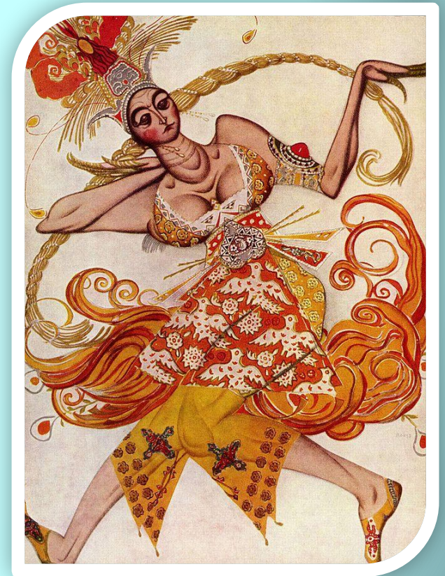
Эскиз костюма жар-птицы (1910)

Сезоны Дягилева — особенно первые, в программу которых входили балеты «Жар-птица», «Петрушка» и «Весна священная» — сыграли значительную роль в популяризации русской культуры в Европе и способствовали установлению моды на всё русское.