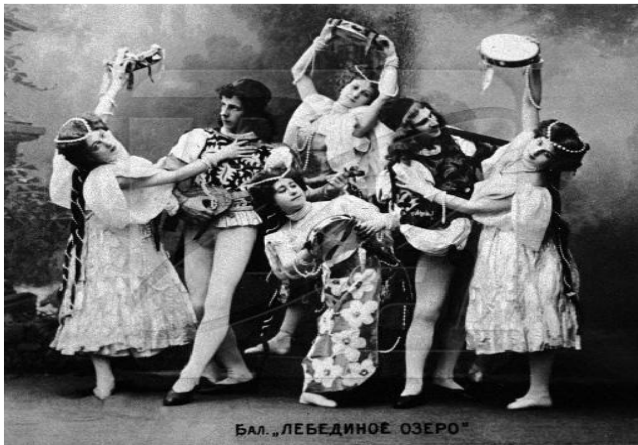
Бал. «ЛЕБЕДИНОЕ ОЗЕРО»