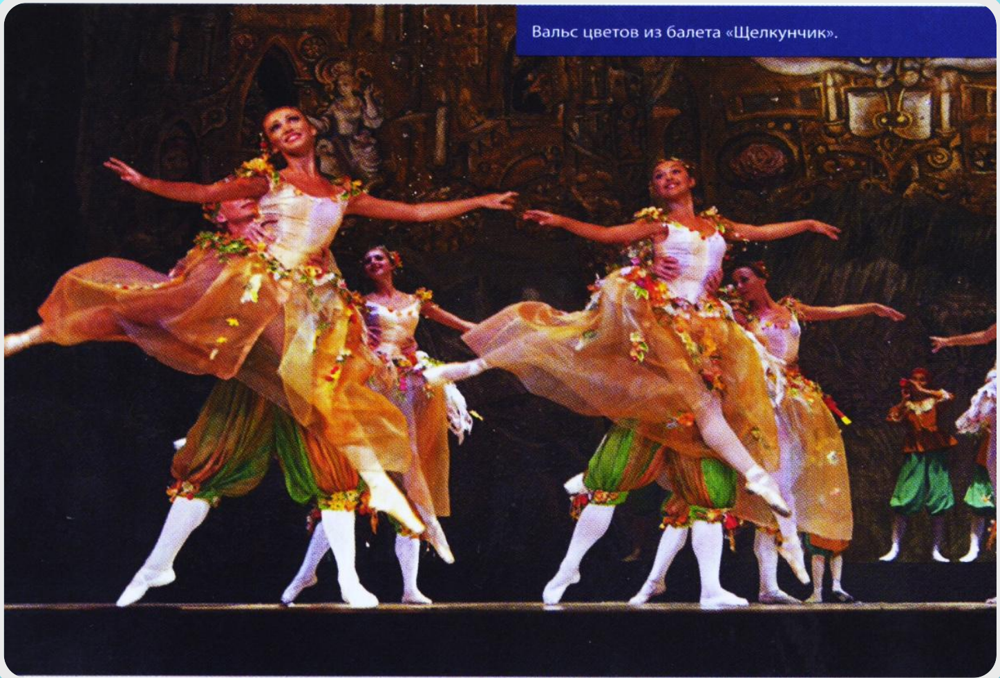
Вальс цветов из балета «Щелкунчик».