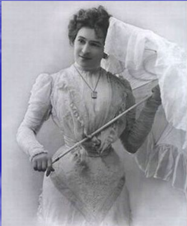
О.Л. Книппер, жена Чехова