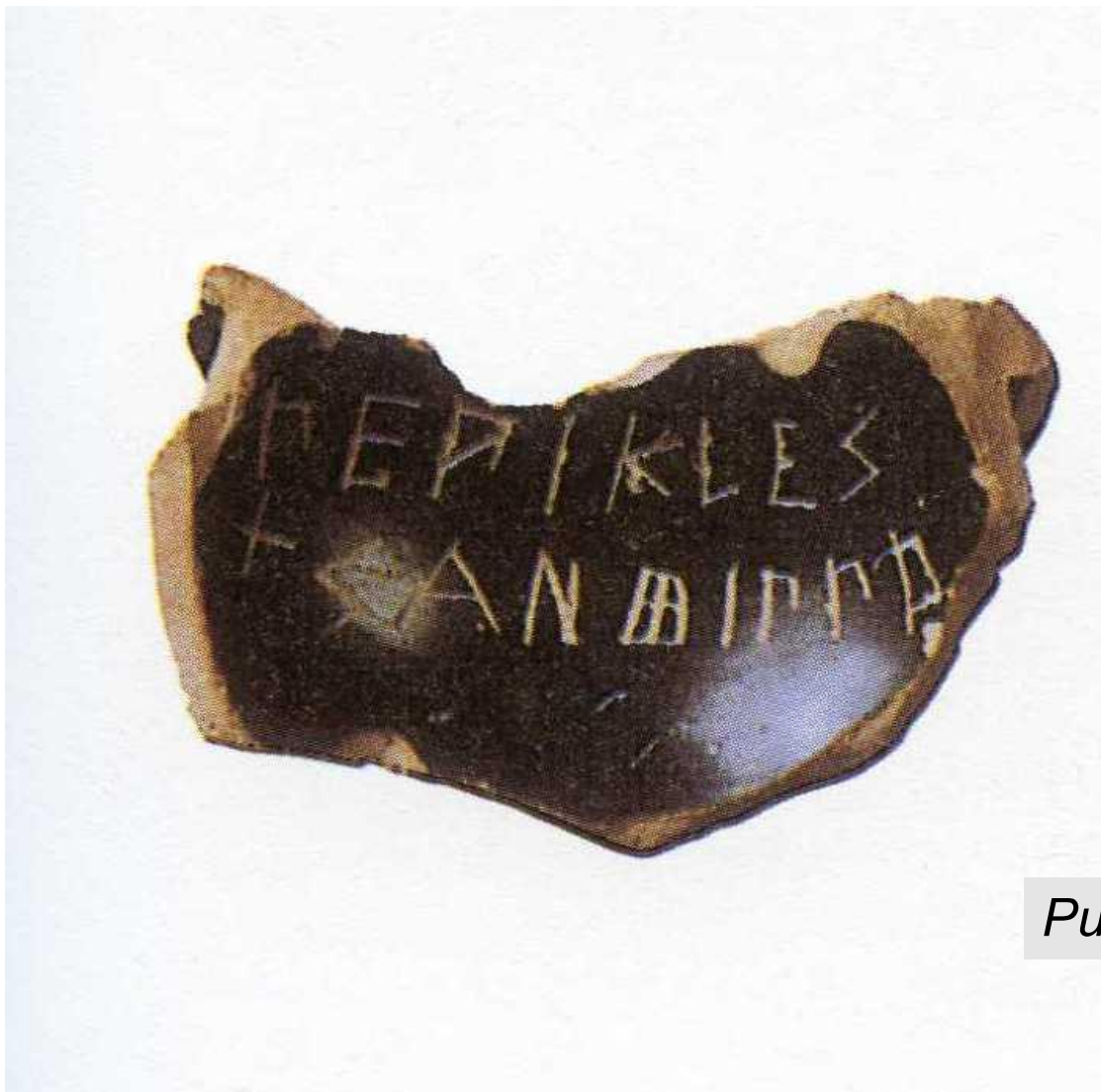
Рис 3. Остракон