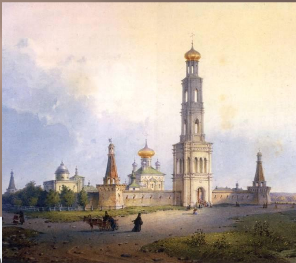
Вид московского Симонова монастыря. Акварель середины XIX века