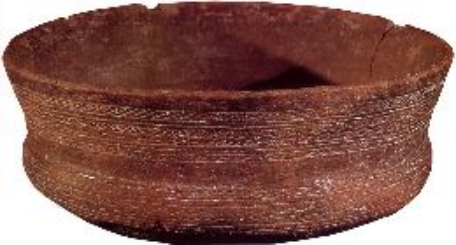
Сосуд колоколообразной формы Испания 3000 до н.э. Испания, Кордова