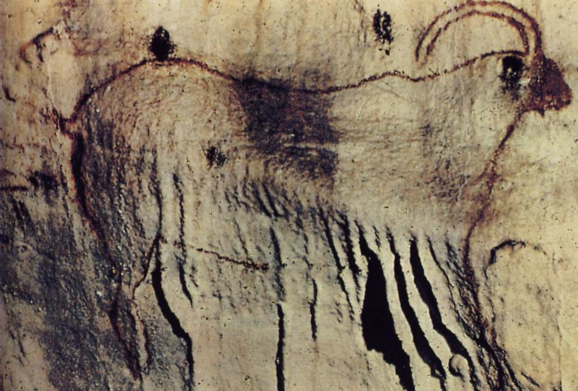
Коза. Наскальная живопись пещеры Альтамира Испания 15 000 - 10 000 до н.э. Испания, Кантабрия