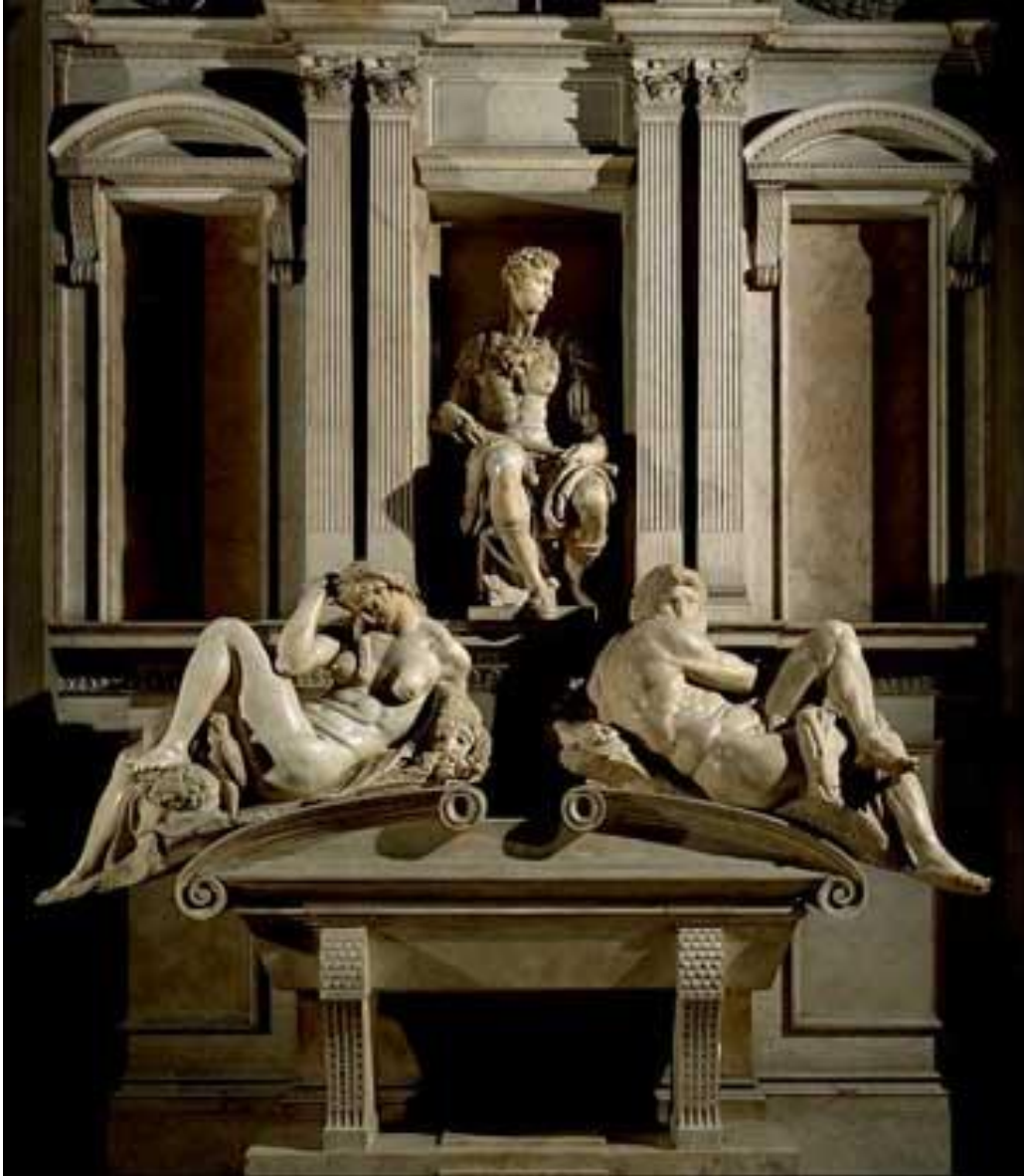
Надгробие Джулиано Медичи Микеланджело