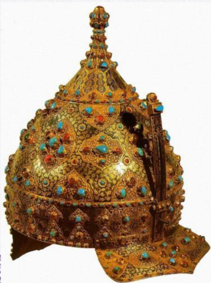
Парадный шлем (Османская империя, середина XVI в., железо, золото, рубины, бирюза).