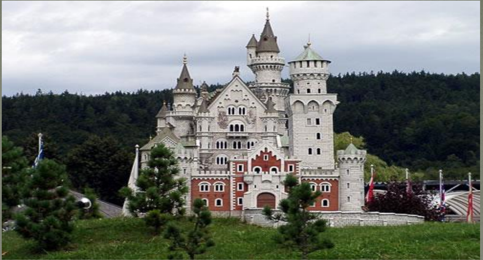
Баварский замок Нойшванштайн