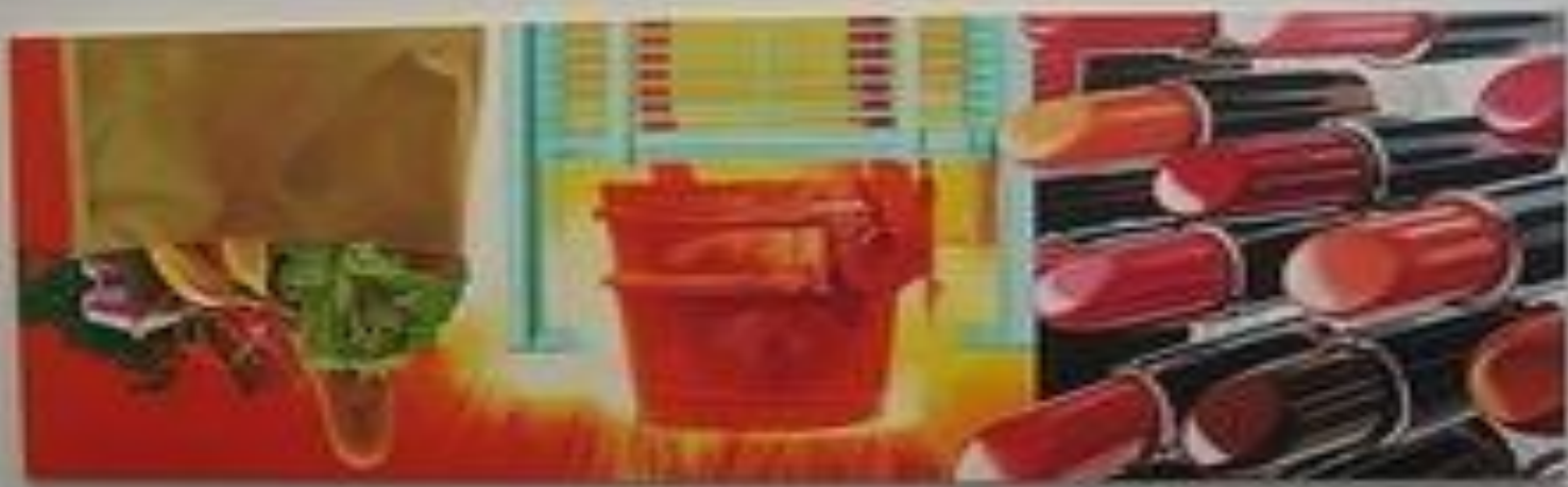
Огненный дом. 1981г.

«Всякий раз, когда я получал новую студию я делал максимально возможное для живописи, но с низким потолком, картины стали горизонтальным.»