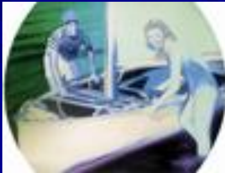
Корабль на телеэкране. 1966.