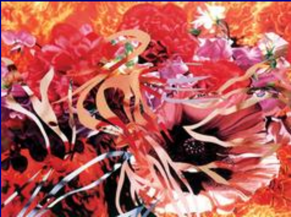
Бисер перед свиньями, цветы перед огнём.1990г.

В поздних произведениях мастера – с преобладающими в них космическими и цветочными мотивами – возобладали более благодушные настроения.