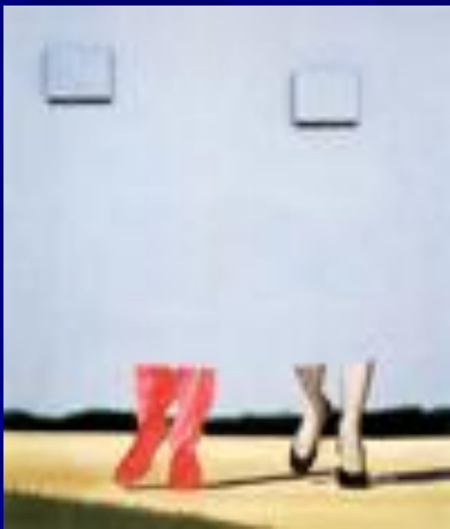
Без названия (Синее небо)1962.

Темные годы Гессквиста проходили в «одноцветной» провинциальной глуши, и встреча с яркими красками и улыбками городской рекламы и, позднее, с телевидением произвела на него неизгладимое впечатление.