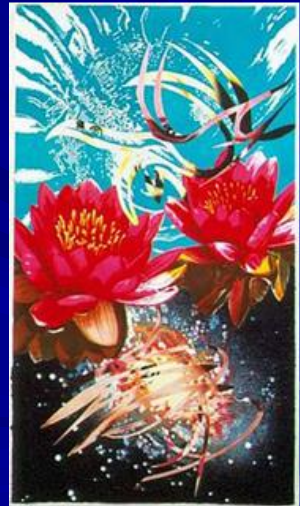
Окно в небо.1989г.