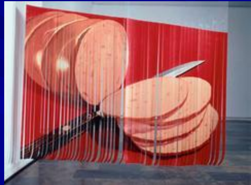
«Лесной странник», Брум-стрит, 1966г.