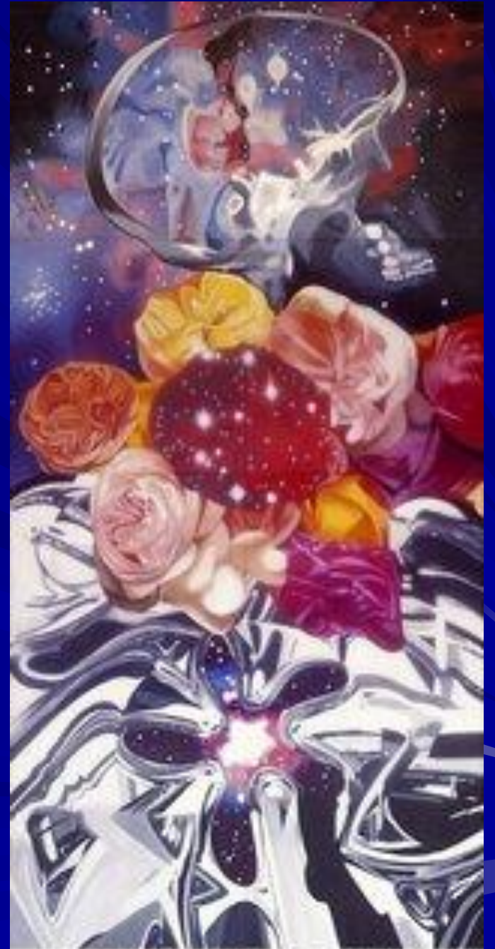
James Rosenquist, Carlotta in Space , 1963.