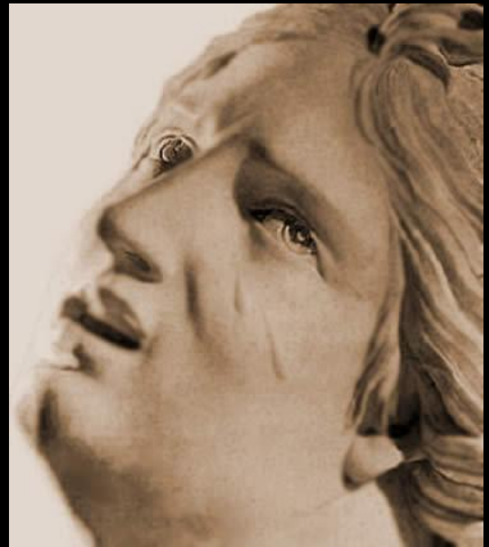
Похищение Прозерпины 1621-1622