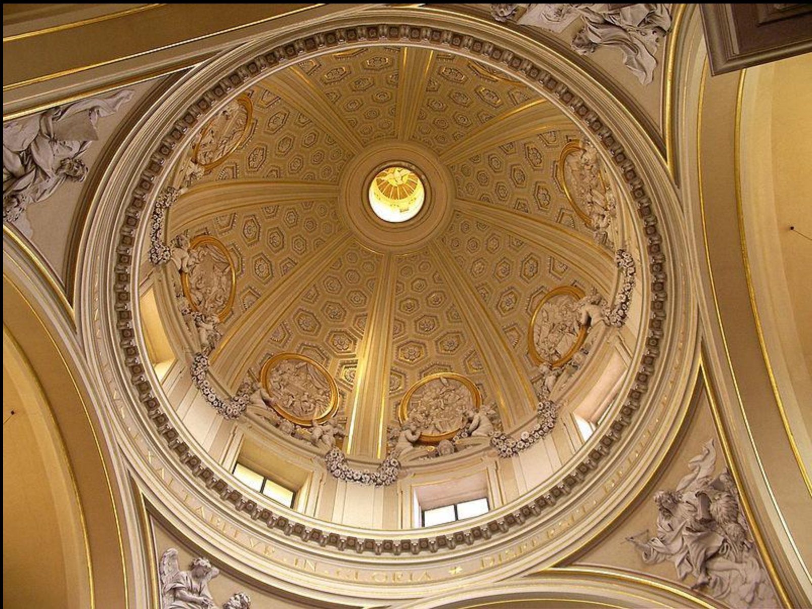
Купол храма в Капель-Гандольфо Приходская церковь, посвященная Святому Томасу Вильянове была разработана Бернини (1658—1661) по заказу Киджи — папы римского Александра VII. Она имеет квадратный план и в ней размещена известная черта Пьетро да Кортоня изображение Распятия на кресте Христа..