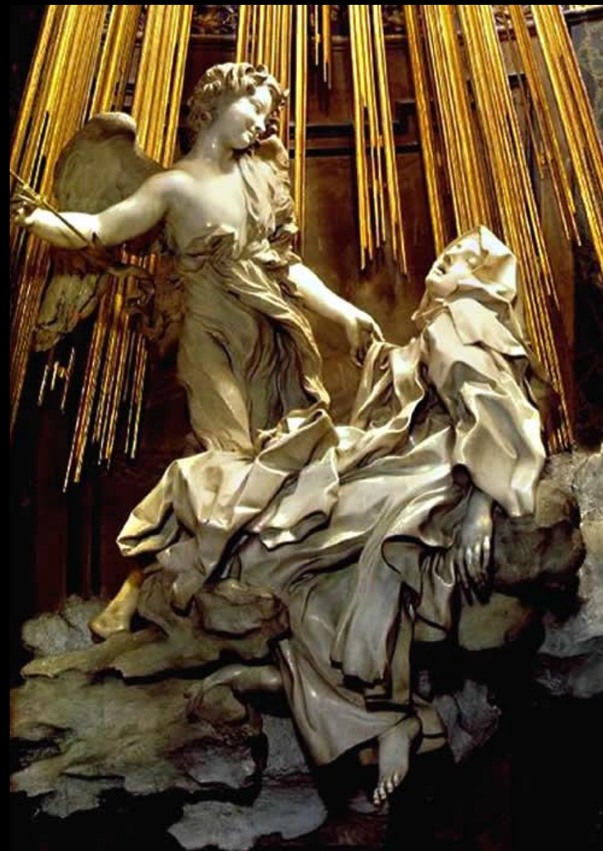
В капелле Корнаро, в Церкви Санта Мария делла Виттория находится алтарная группа «Экстаз святой Терезы», выполненная в 1652 г. Бернини. Тереза, которой в состоянии экстаза является ангел с золотой стрелой, полулежит на мраморном облаке.