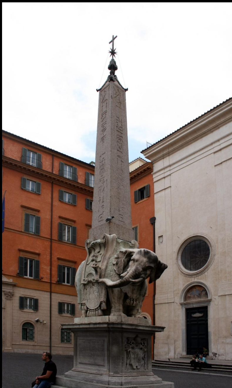
«Слон Минервы» перед Санта- Мария-сопра-Минерва. Obelix_Place_de_la_Minerve