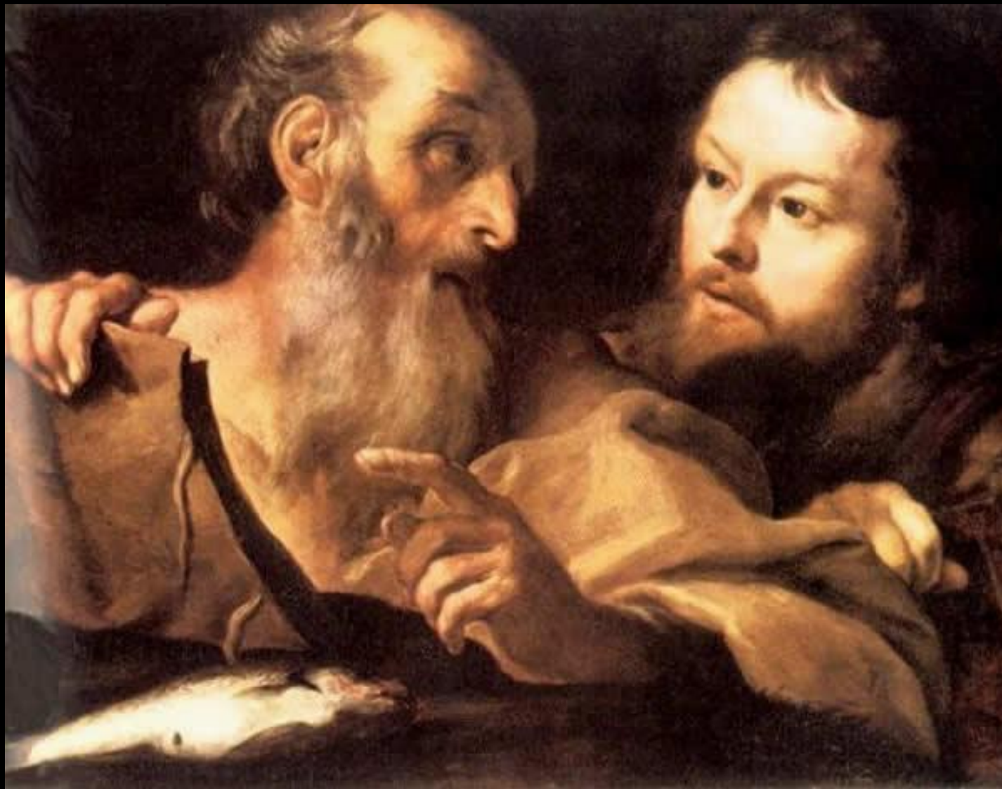
Святой Андрей (Эндрю) и Святой Томас Масло, холст 59 x 76 см Лондонская национальная галерея