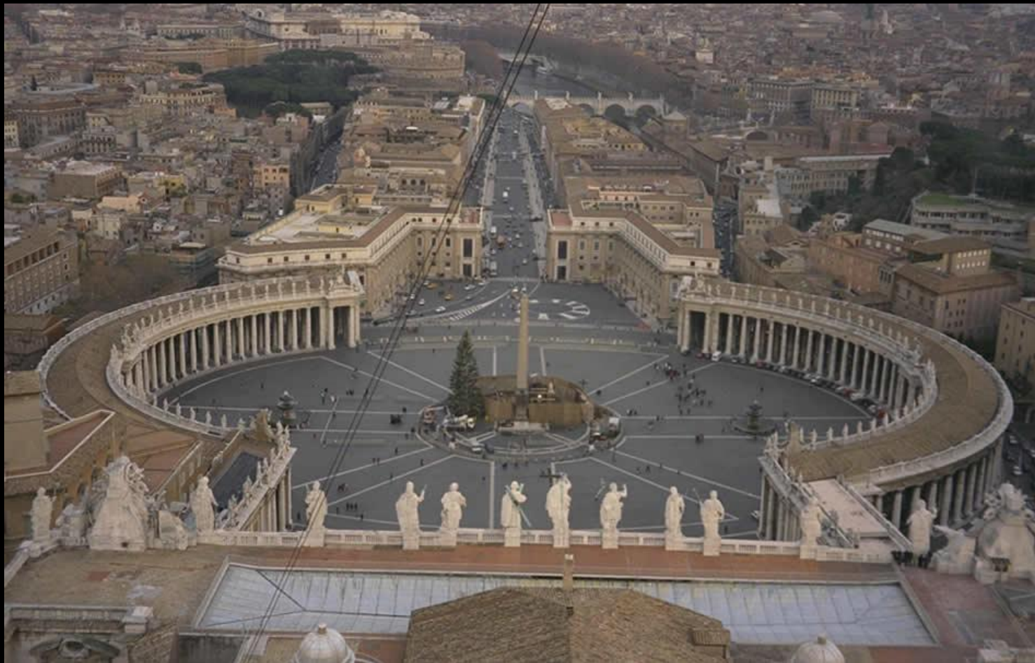
Колоннада собора святого Петра в Риме

Площадь обрамляют спроектированные Бернини полукруглые колоннады тосканского ордера. Посередине — египетский обелиск, привезённый в Рим императором Калигулой. Это единственный обелиск в городе, который простоял в неизменном виде вплоть до Возрождения. Средневековые римляне полагали, что в металлическом шаре на вершине обелиска хранится прах Юлия Цезаря. От обелиска по брусчатке расходятся лучи из травертина, устроенные так, чтобы обелиск выполнял роль гномона.