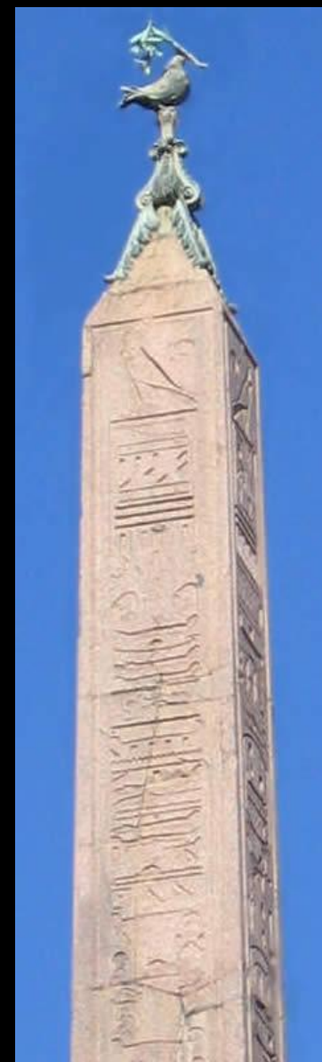
Фонтан Четырех Рек на площади Навона в Риме