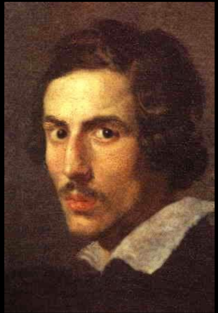
Бернини Лоренцо Джованни Автопортрет