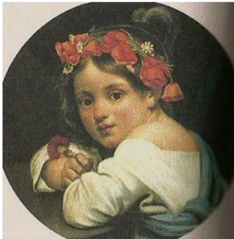
О.Кипренский «Девочка в маковом венке» 1819