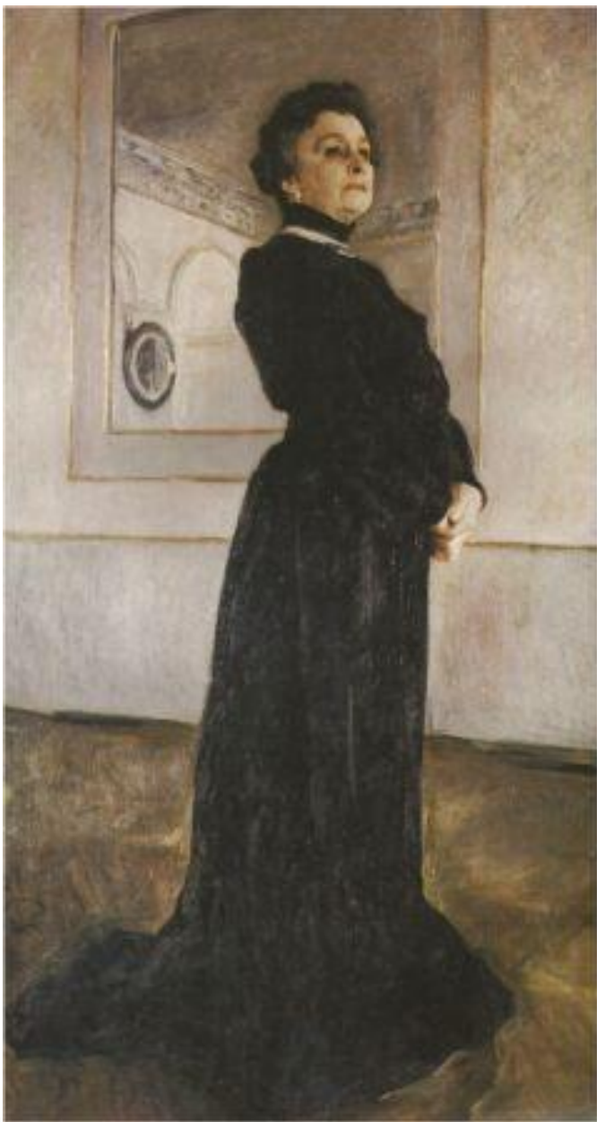
В.Серов «Портрет М.Н.Ермоловой» 1905