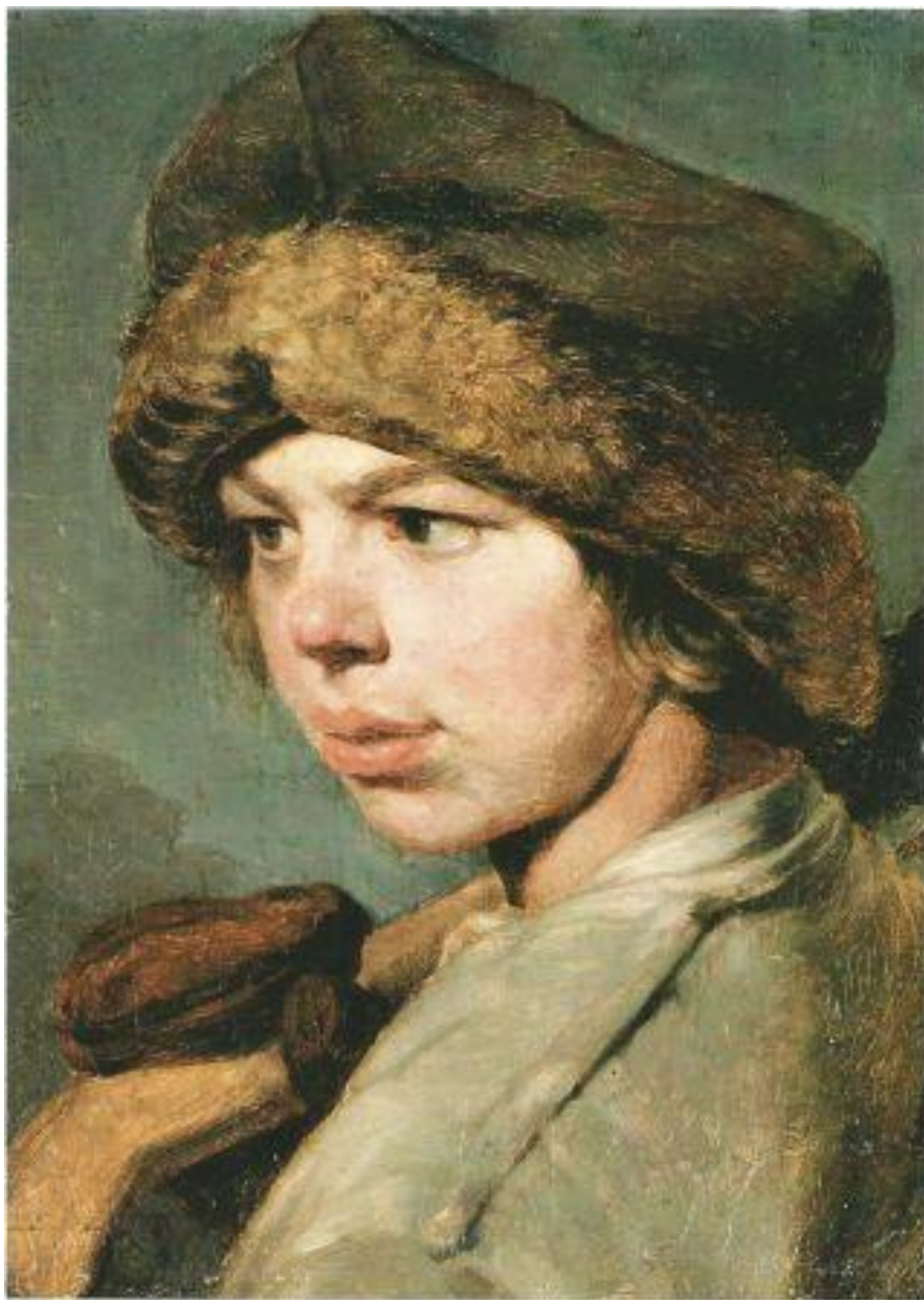
А. Венецианов «Захарка» 1825