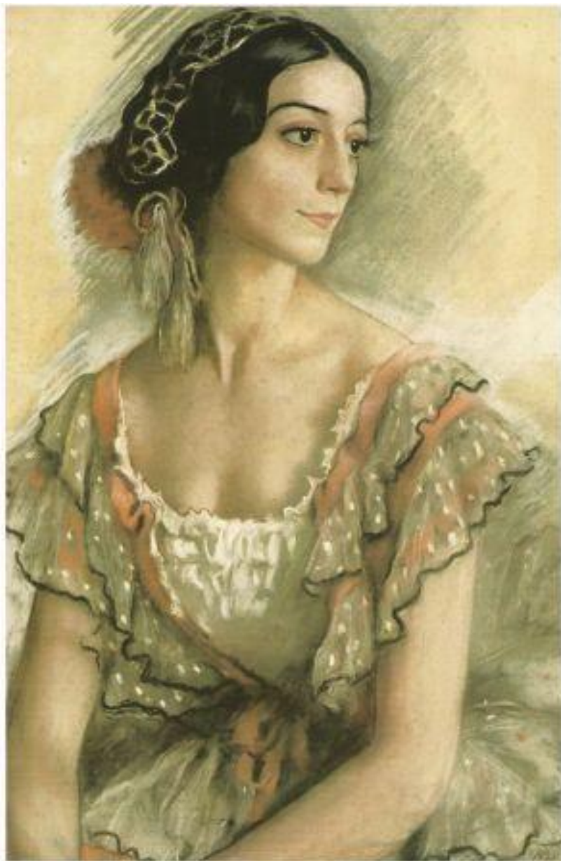
З.Серебрякова «Портрет балерины В.К. Ивановой в костюме испанки» 1924