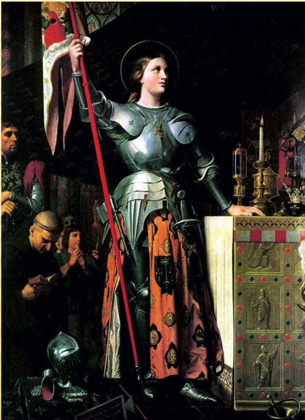
ЖАННА Д'АРК НА КОРОНАЦИИ КАРЛА VII», 1854 Г

17 июля 1429 года, через три месяца после того, как святая Дева Жанна явилась миру, Карл VII был коронован в Реймсе. Коронация дофина стала актом провозглашения государственной независимости Франции. Жанна д'Арк во время обряда держала над королем знамя.