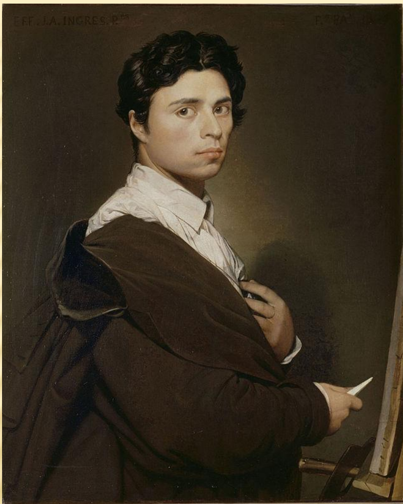
ЖАН ОГЮСТ ДОМИНИК ЭНГР - ФРАНЦУЗСКИЙ ЖИВОПИСЕЦ