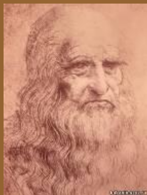
Леонардо да Винчи