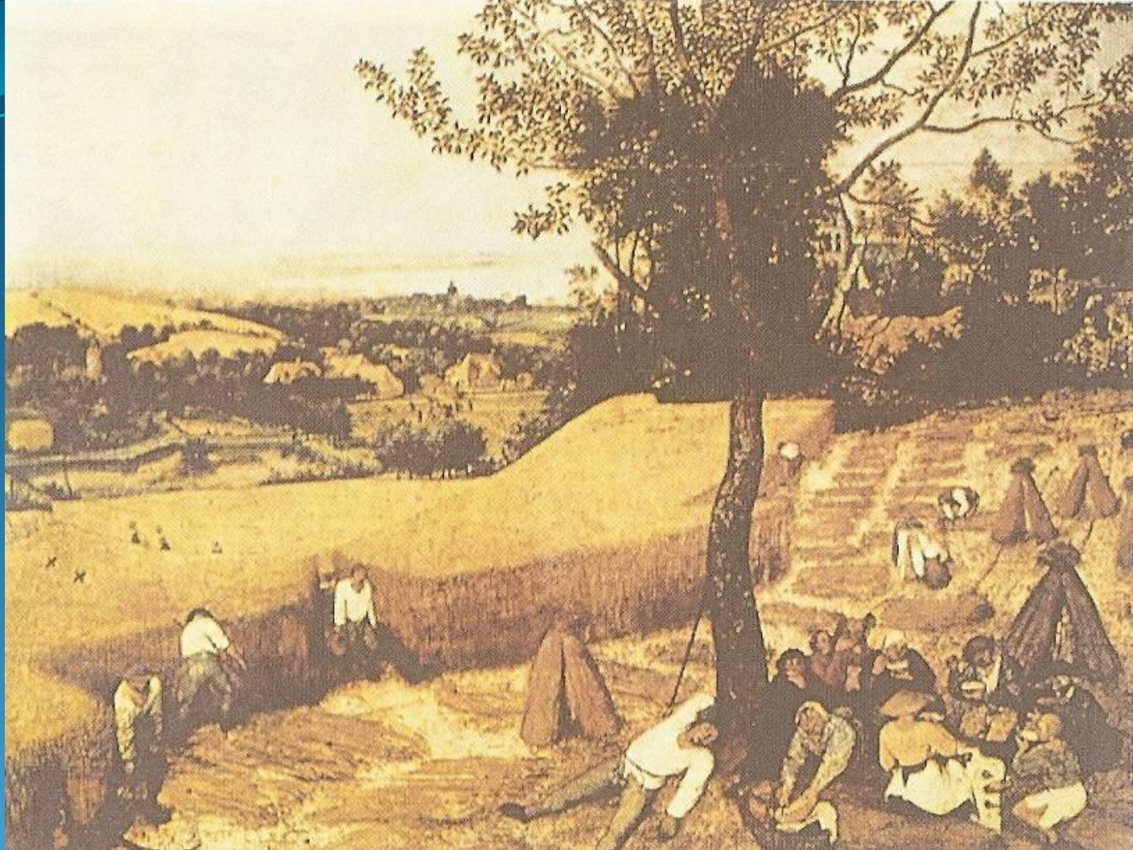
Северное Возрождение. Питер Бреггел 1525 – 1530 – 1569 гг. Картина «Жатва».