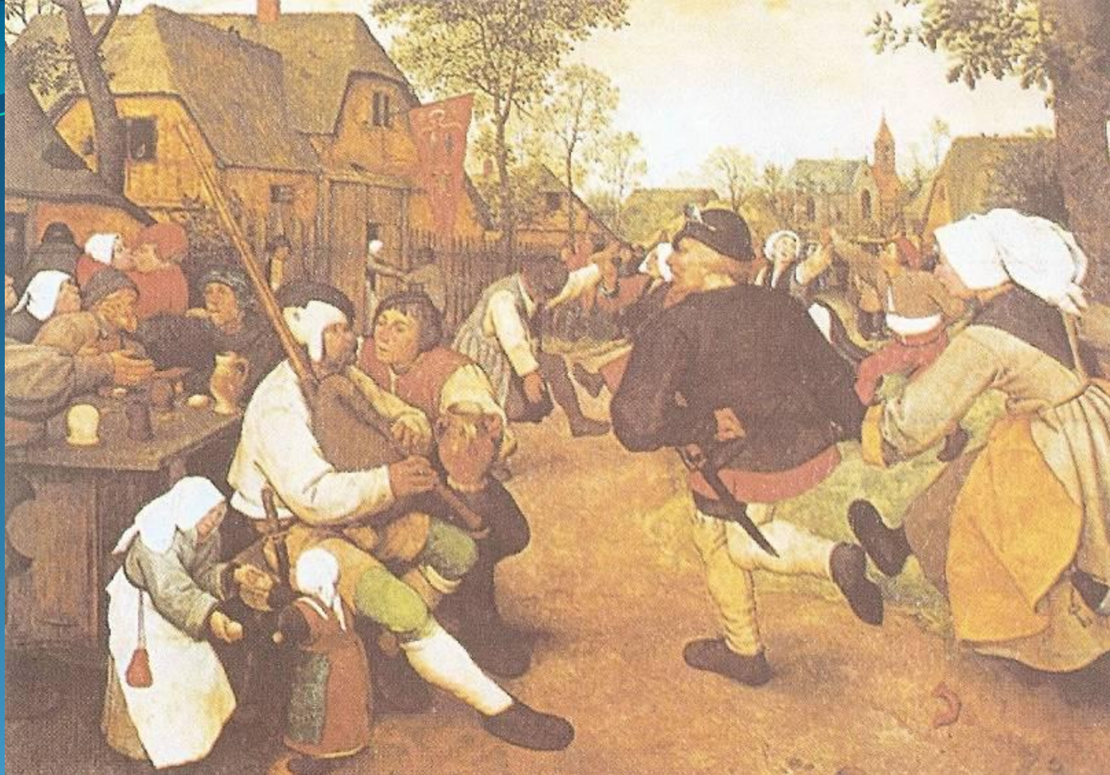
Крестьянский танец 1568 год.