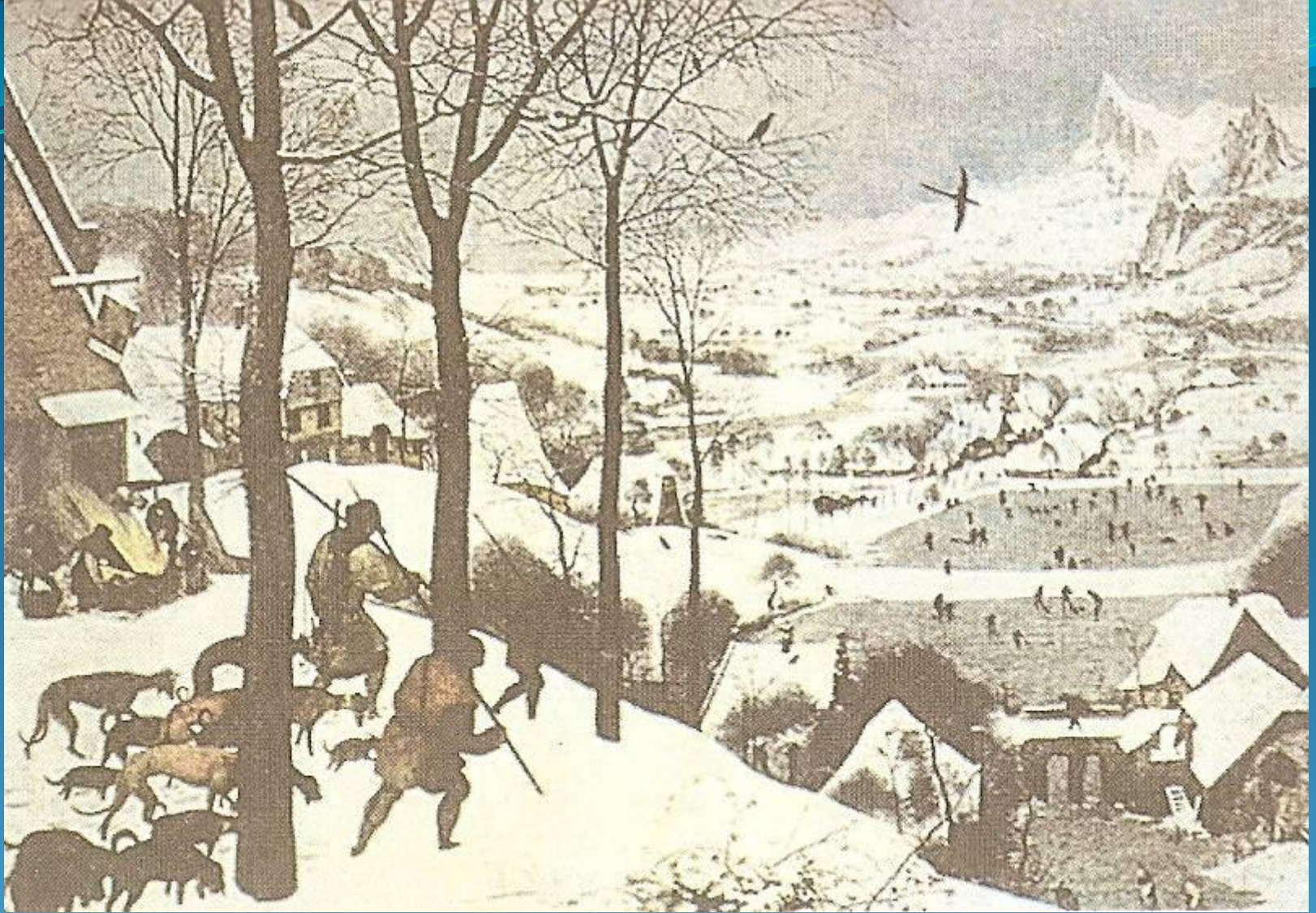
Охотники на снегу 1565 год.