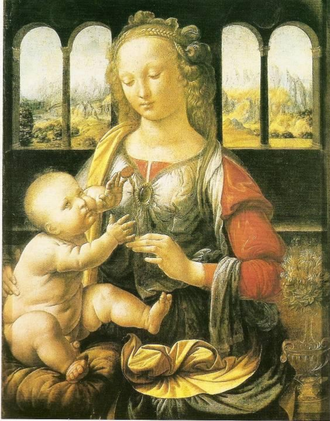
Мадонна с гвоздикой 1473 г.