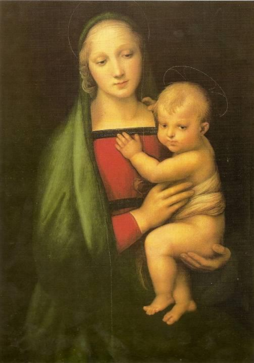
Мадонна Дель Грандука. 1506 ГОД.