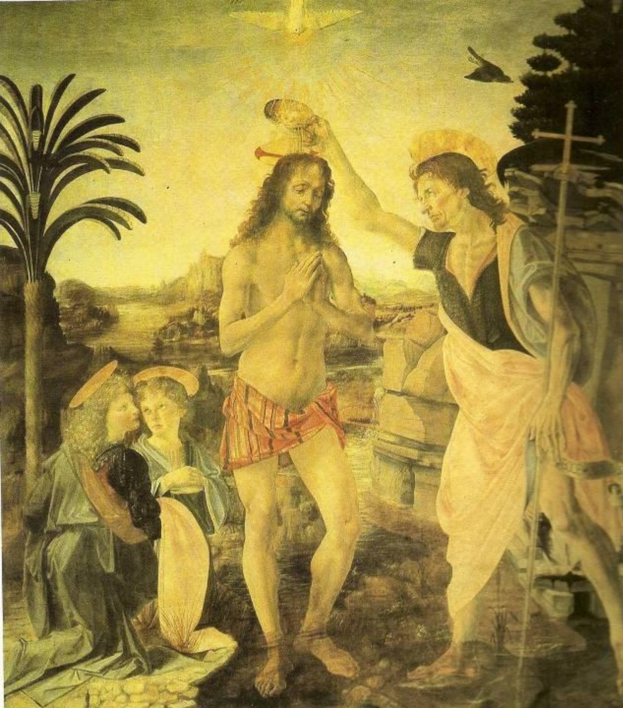
Крещение Христа 1473-1478 гг. Андреа Вероккио.