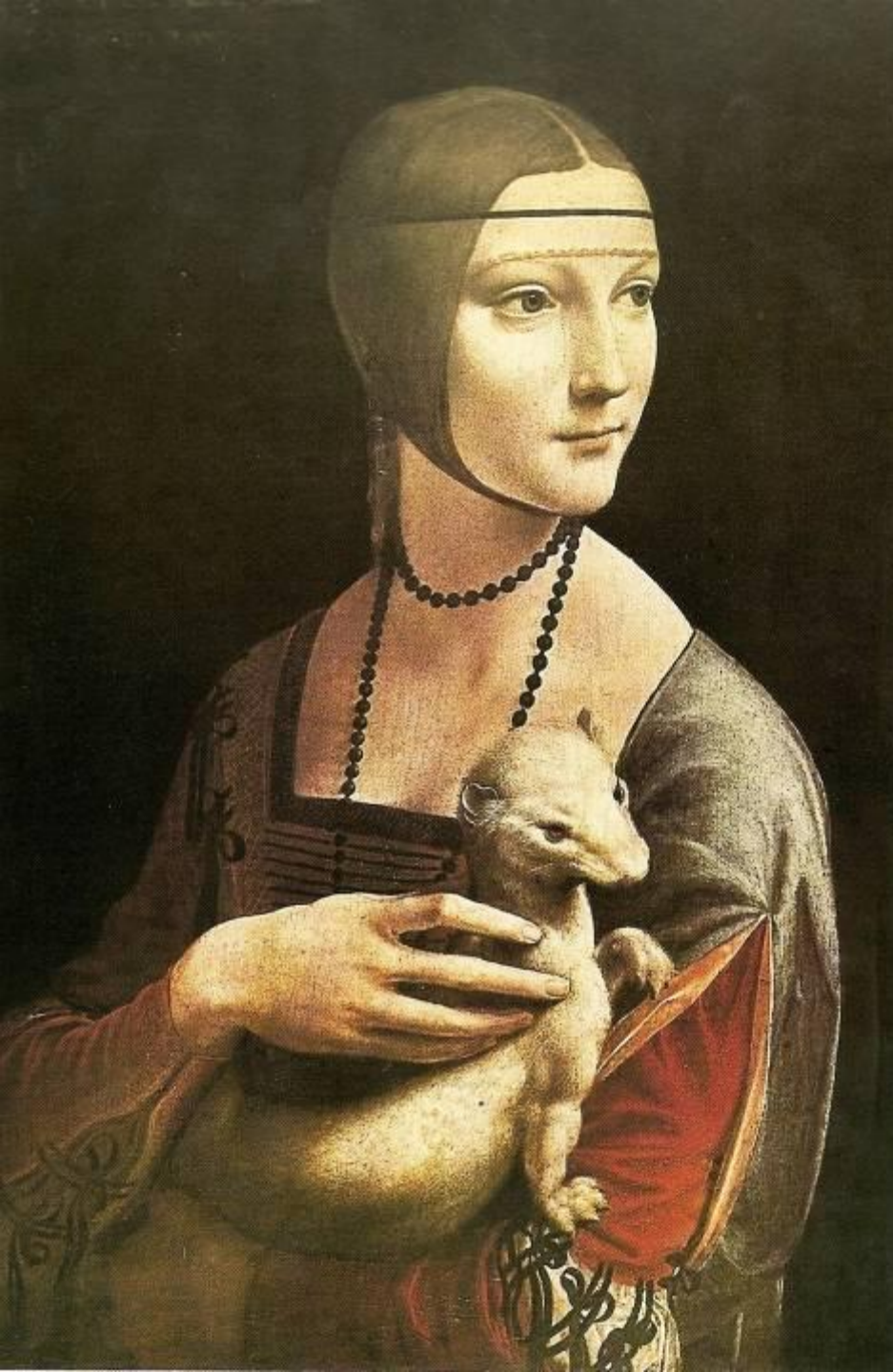
Портрет Чечилии Галлерани 1485 – 1490 г.