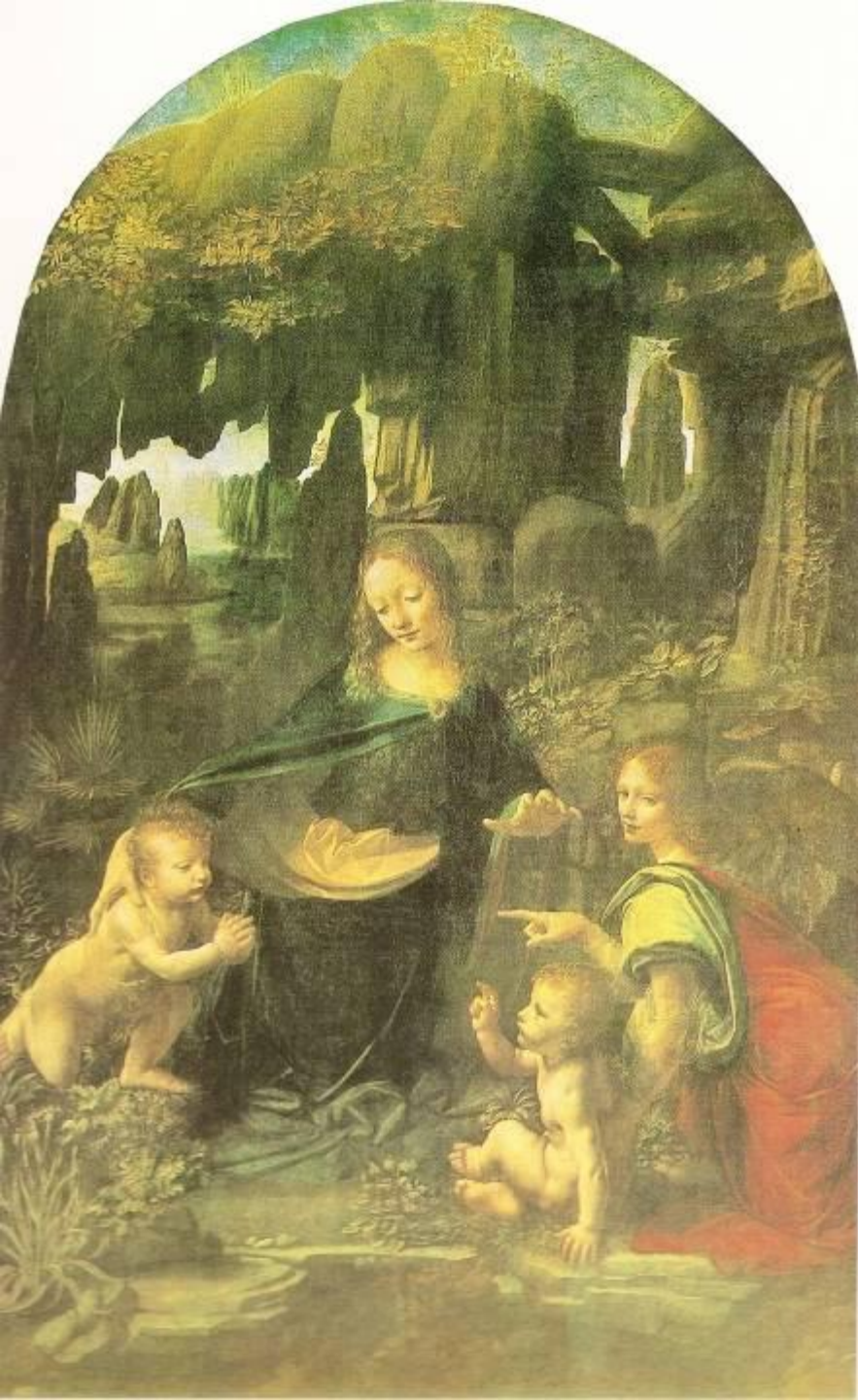
Мадонна в скалах.