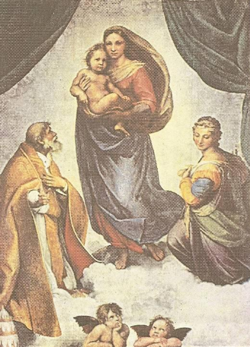
Сикстинская Мадонна. 1513 – 1514 гг.