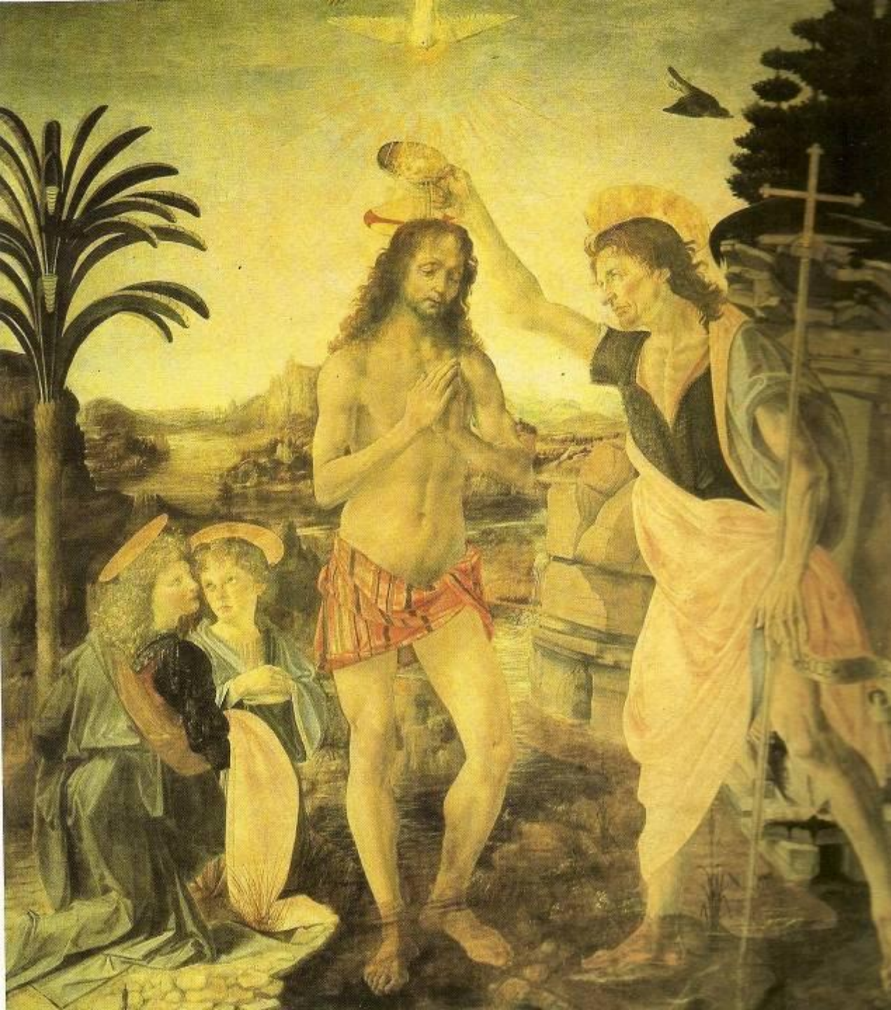
Крещение Христа 1473-1478 гг. Андреа Вероккио.