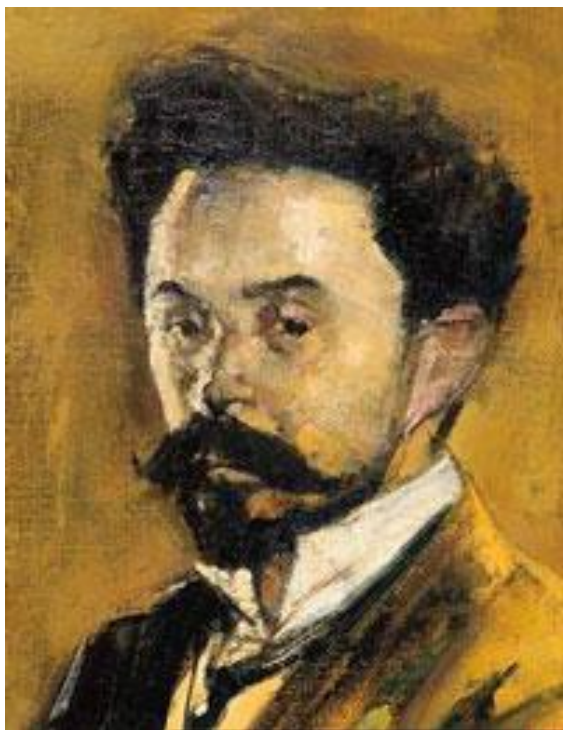
Александр Николаевич Скрябин