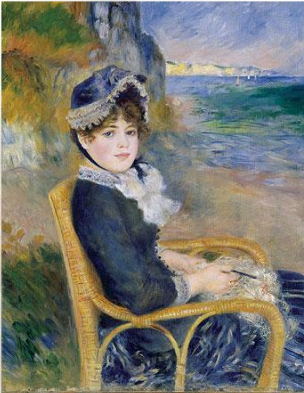
Пьер Ренуар «У моря»