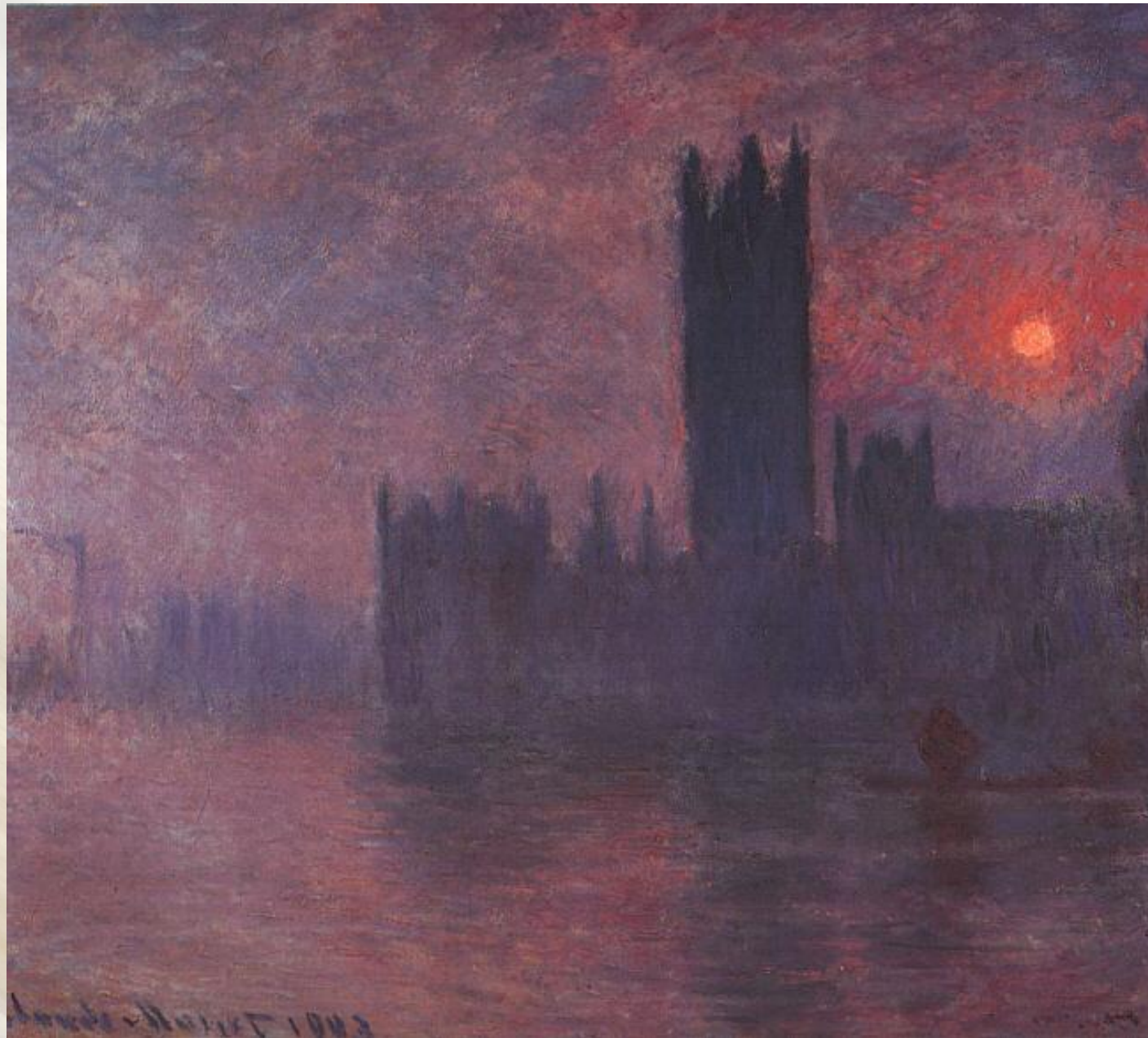
Клод Моне «Лондонский туман»