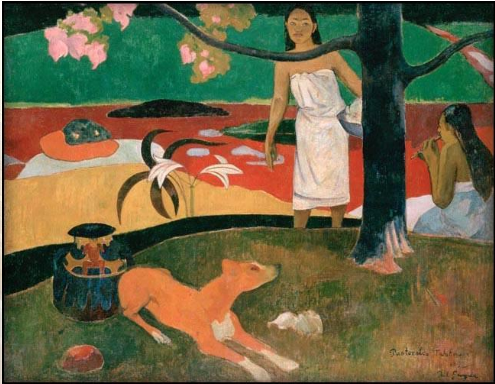
Поль Гоген «Таитянские пасторали»