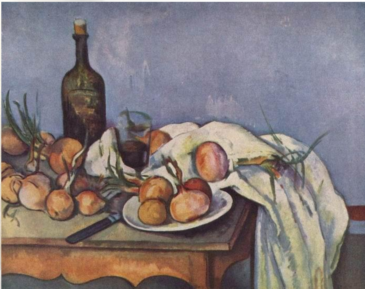
Поль Сезанн «Натюрморт с луком»