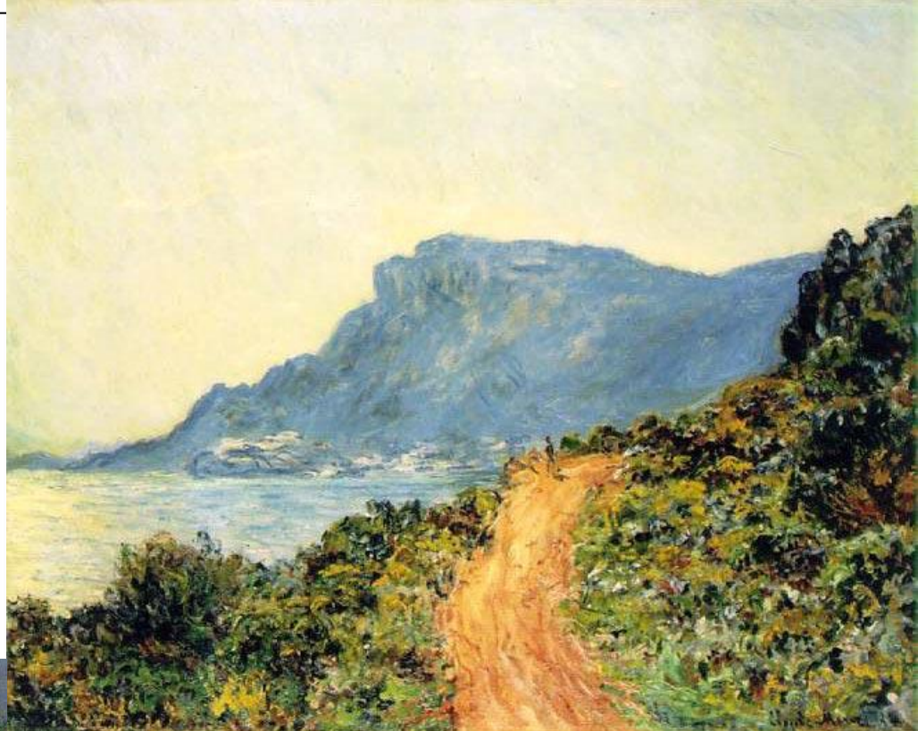
Рис.8 Моне К. «Пейзаж в Монако»

Импрессионисты предложили новое видение мира и новые принципы живописи. Они воспринимали окружающую действительность как бесконечную смену впечатлений. Картина становится как бы отдельным кадром, фрагментом подвижного мира. Появилась свежесть и непосредственность в изображении повседневной жизни современного города, его пейзажей, вида, быта и развлечений его жителей.