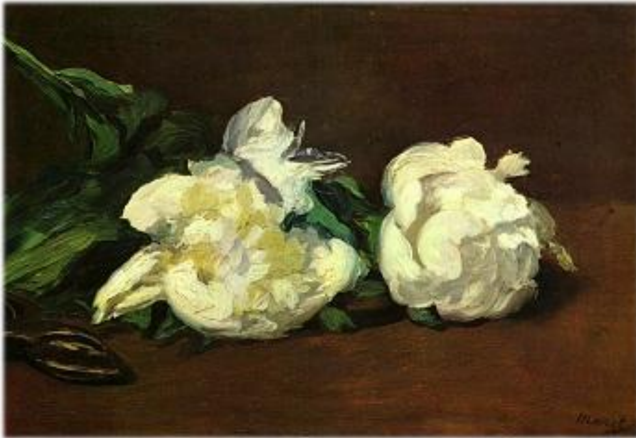
Рис.10 Мане Э. «Белые пионы.» 1864

Живопись мгновения, впечатление для глаз. Трепещущий от солнца и воздуха цвет. Импрессионисты ввели и новую живописную технику, отказались от смешанных цветов, начали писать чистыми яркими красками, густо нанося их отдельными мазками (при восприятии, оптически смешиваясь, для зрителя они давали нужный тон). Самые известные художники этого направления живописи: Мане, Ренуар, Сезанн, Дега, Моне, Писсарро.