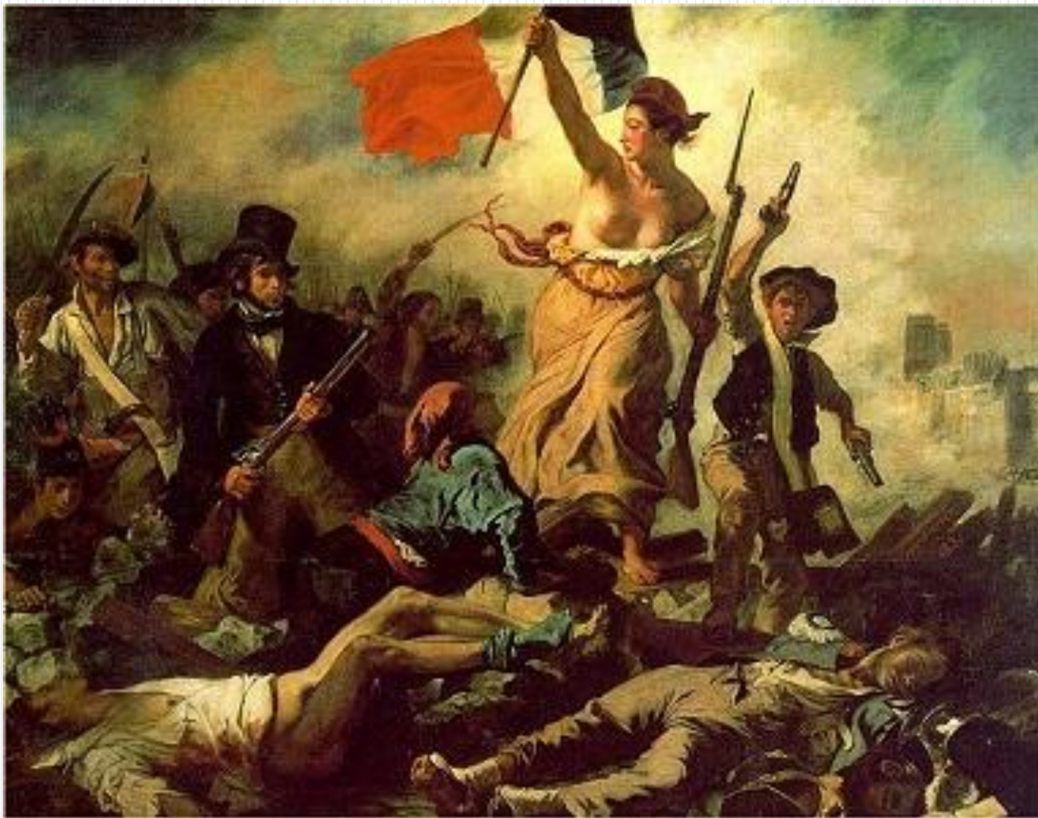
Рис.2 Э. Делакруа «Свобода, ведущая народ», 1830