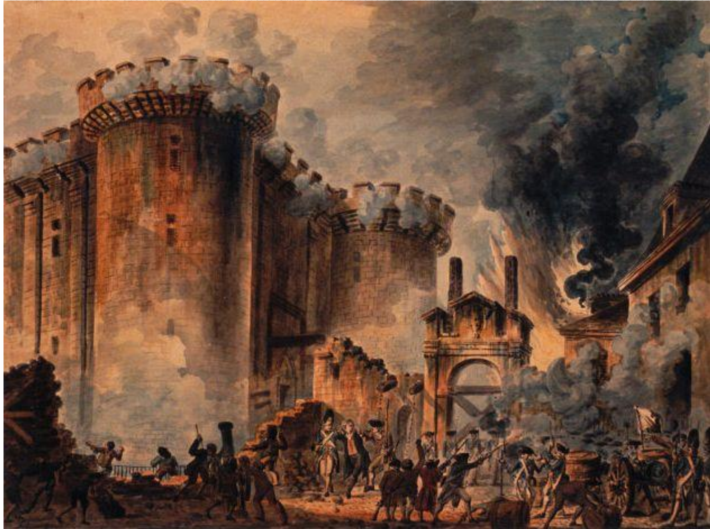
Рис.1 «Взятие Бастилии 14 июля 1789», Жан-Пьер Уэль

Великая Французская революция (1789—1799 гг.), уничтожившая монархию и установившая республику, надолго определила пути развития европейской культуры.