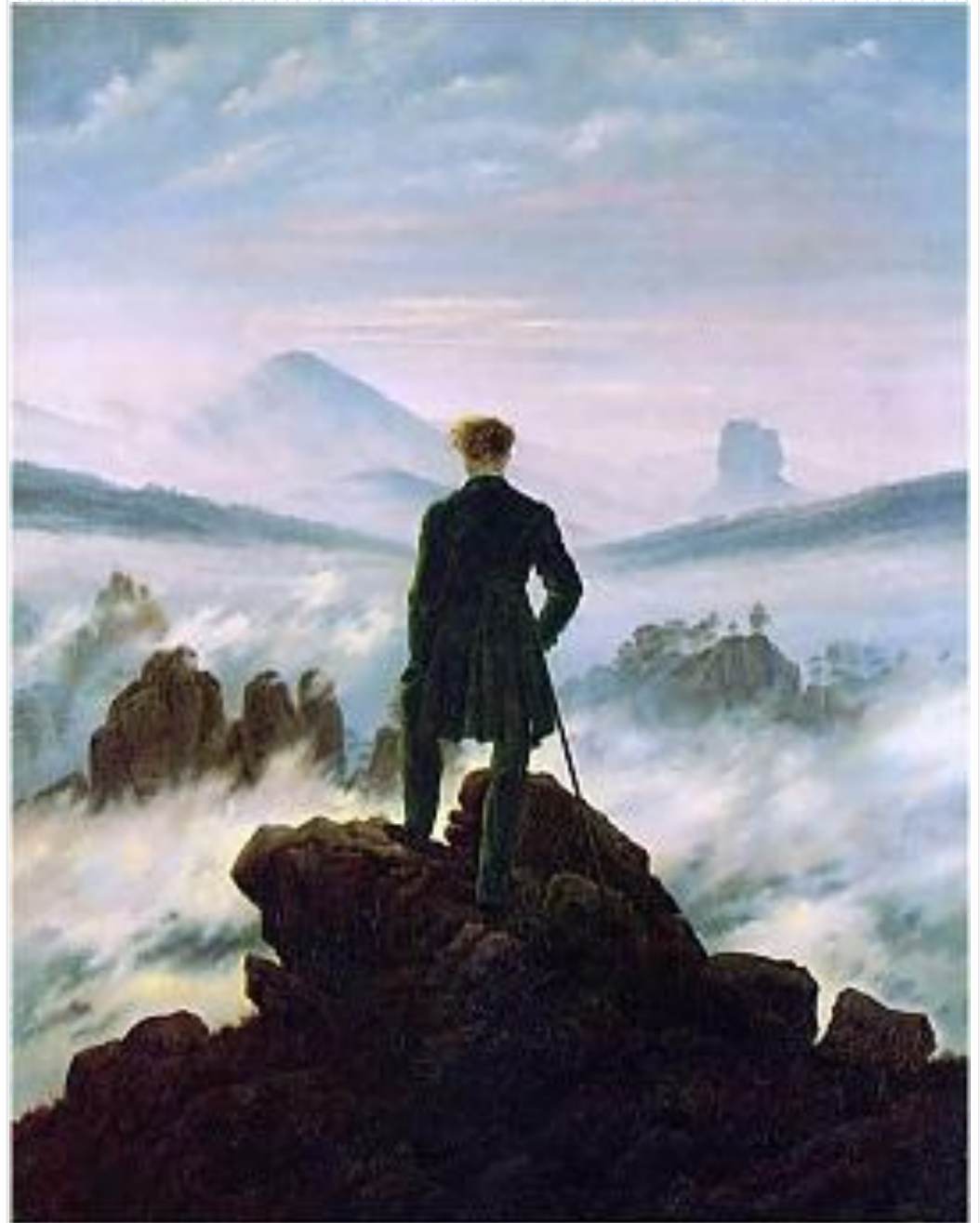
Рис.3 «Странник над морем тумана». Каспар Давид Фридрих, 1818.

Мир романтиков таинствен, противоречив и безграничен; художник должен был воплотить его многообразие в своём творчестве. Основное в романтическом произведении — чувства и фантазия автора. Для художника романтика не было и не могло быть законов в искусстве: ведь всё, что он создавал, рождалось в глубине его души. Единственное правило, которое он чтит, — это верность себе, искренность художественного языка.