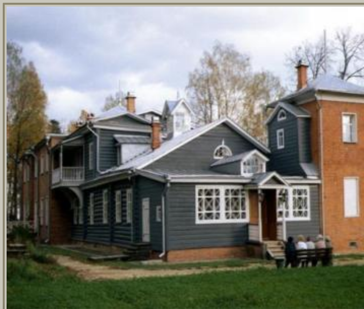
Музей-усадьба Мураново в Московской области