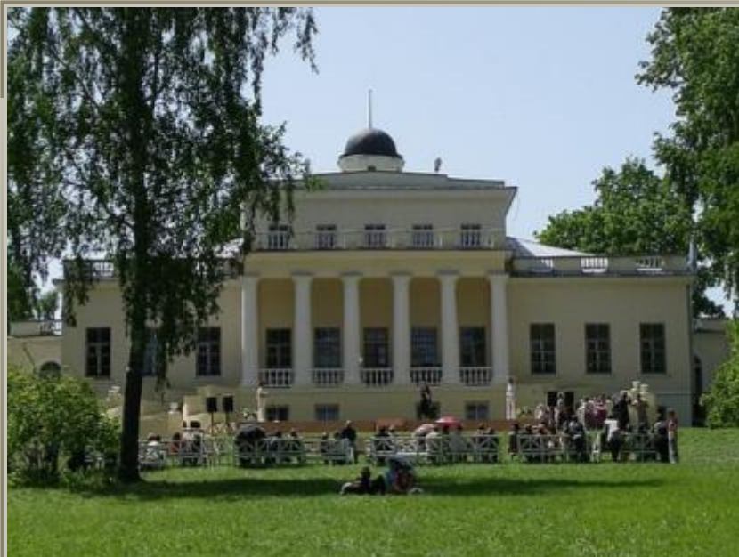
Музей-усадьба в Овстуге