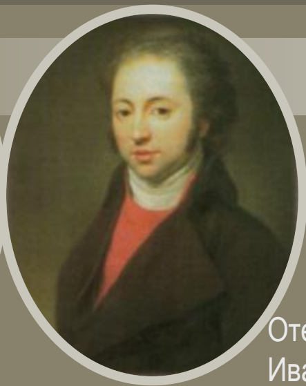
Отец Тютчева Иван Николаевич