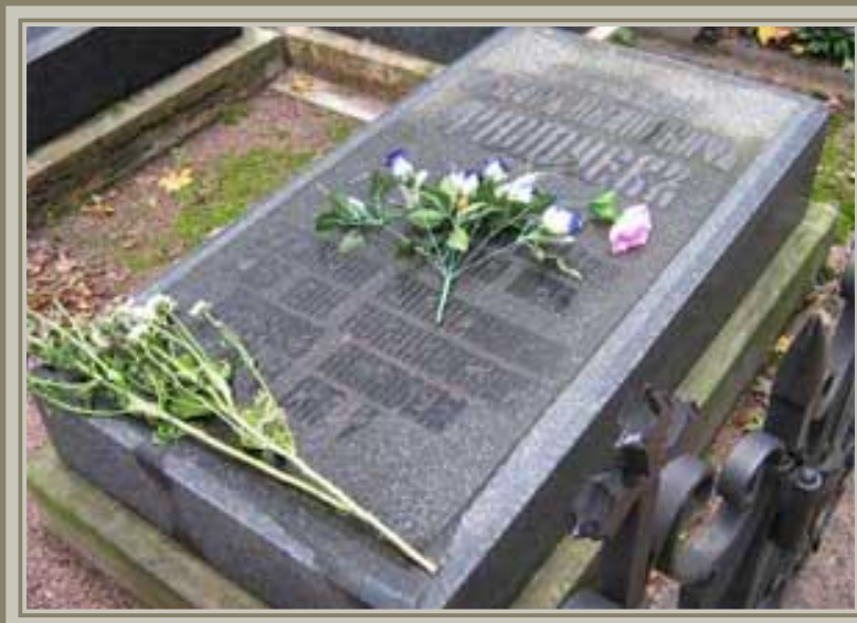
Могила Тютчева в Петербурге на кладбище Новодевичьего монастыря