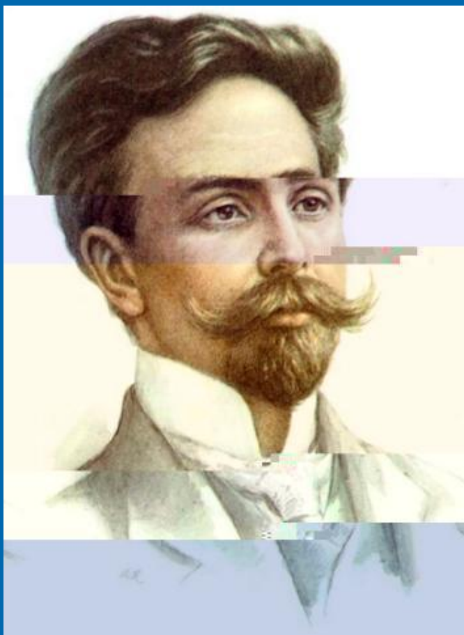
Александр Николаевич Скрябин (1872-1915)