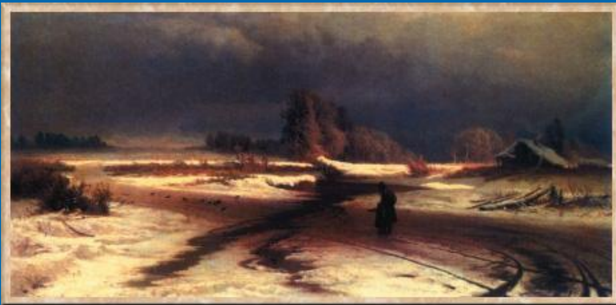
Оттепель. 1871. Масло