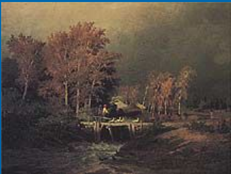
Вид на Волге. Барки. 1870. Масло