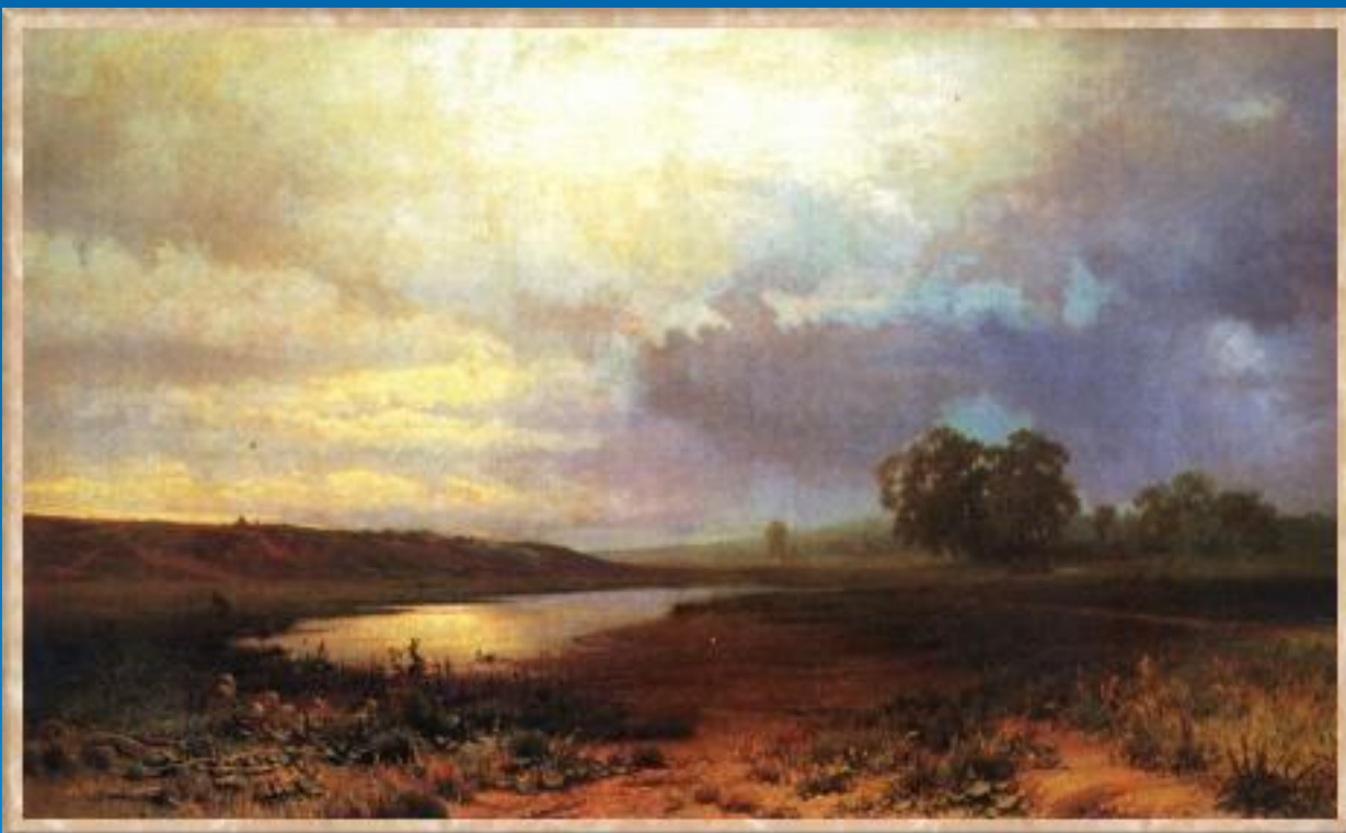
Мокрый луг. 1872. Масло