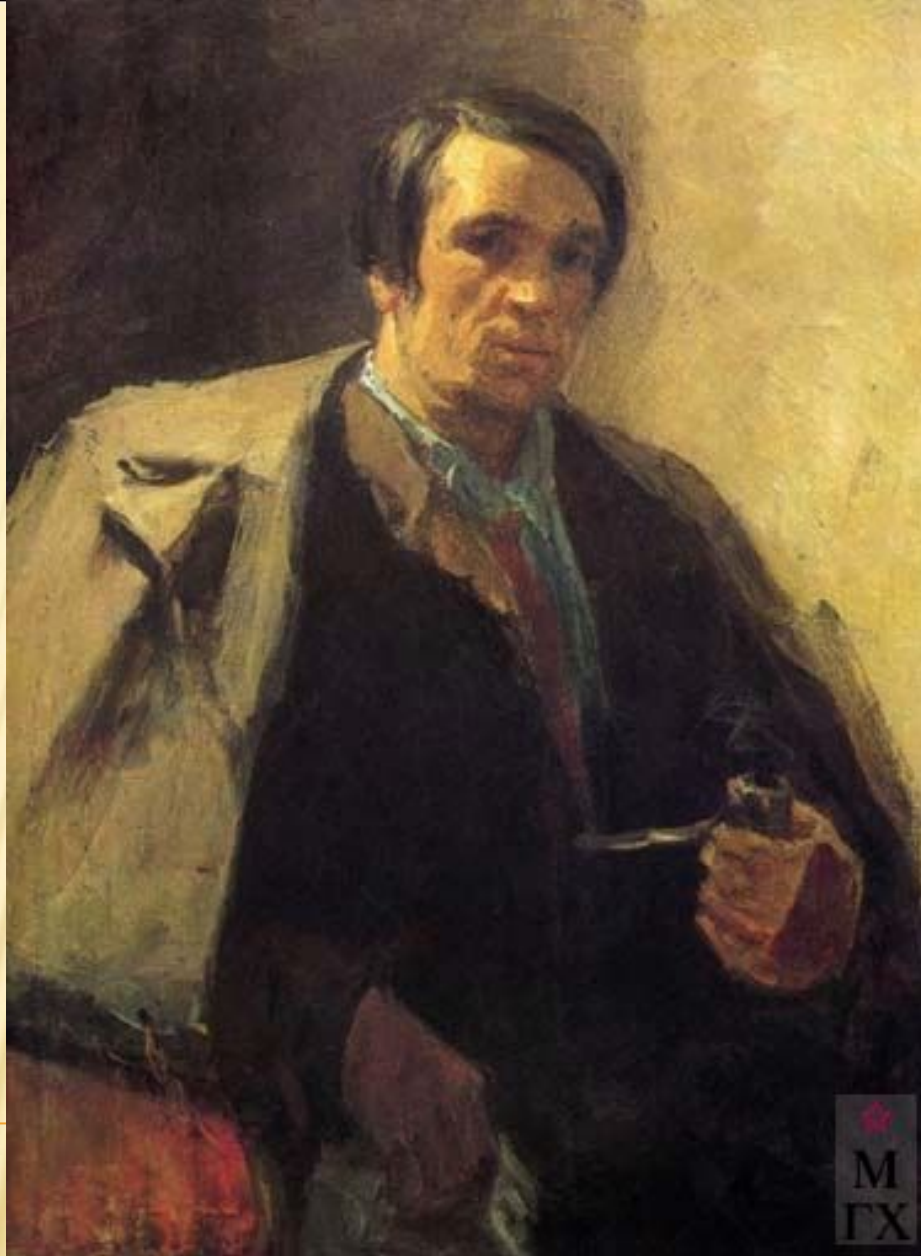
Федор Павлович Решетников (1906–1988)