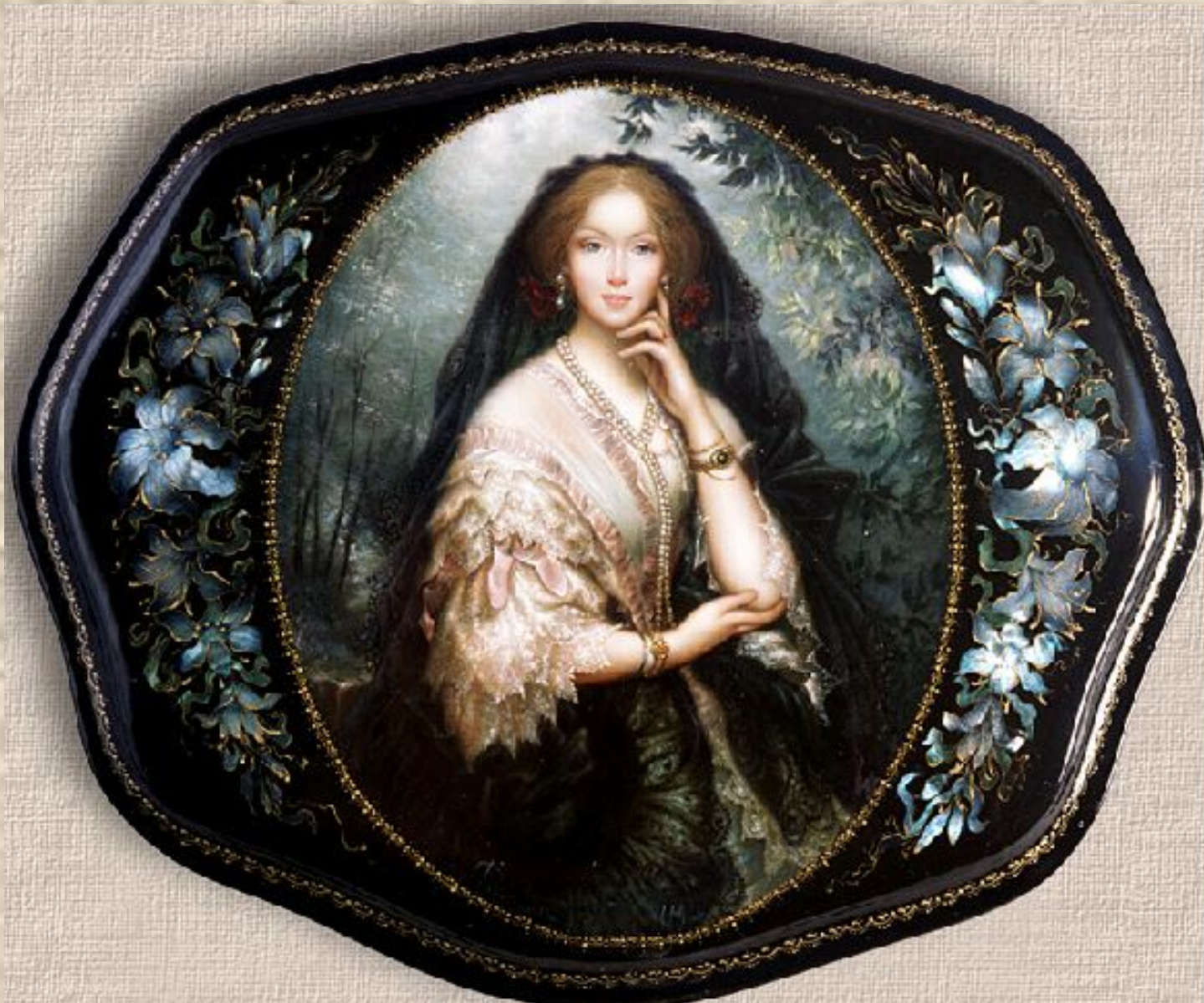
Федоскино. Шкатулка «Весна»