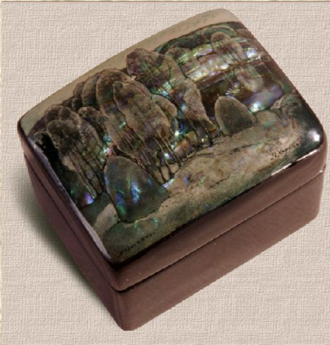
Федоскино. Коробочка «Роща»