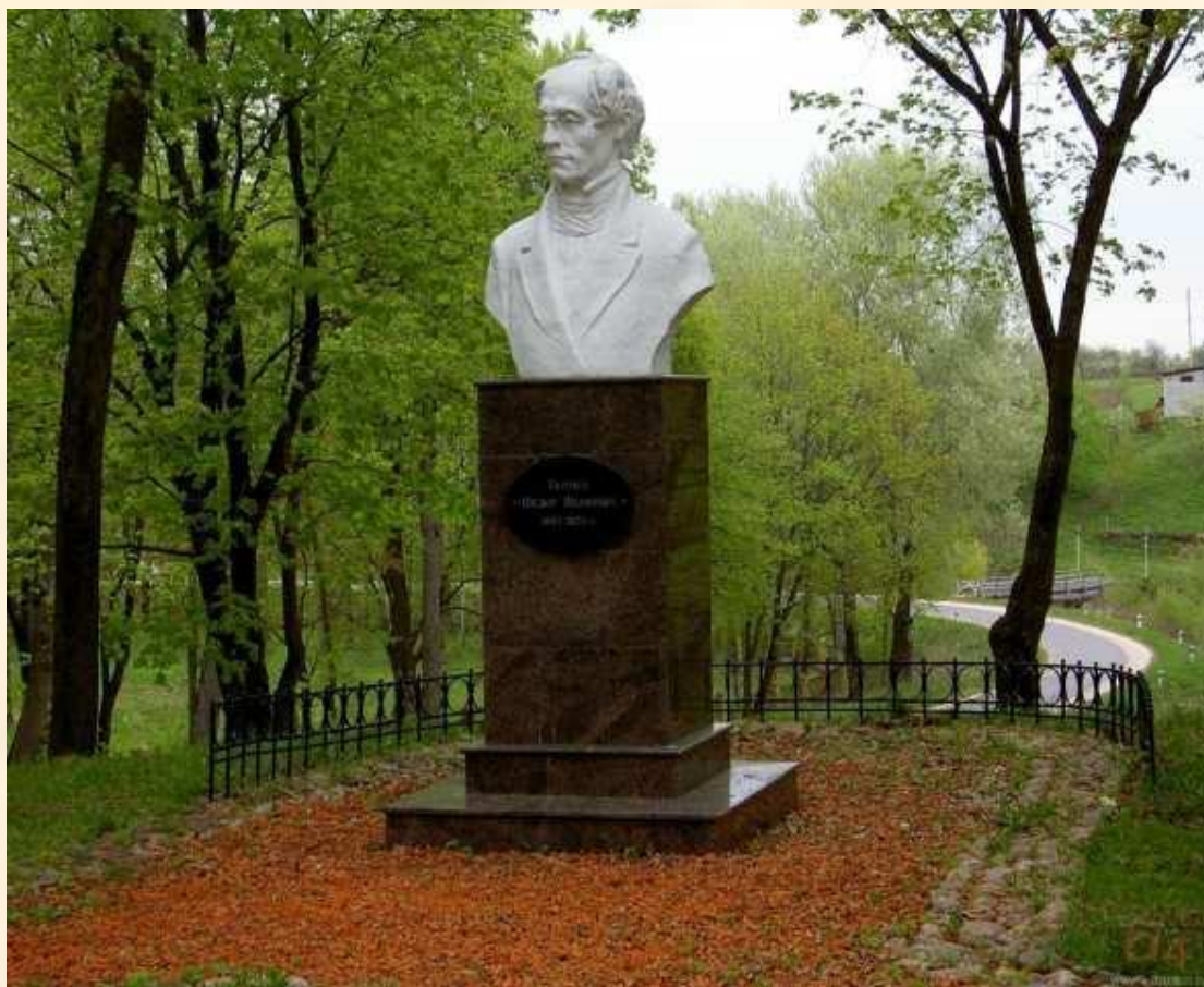
Памятник Ф.И. Тютчеву в Овстуге