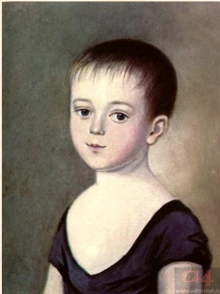
Ф.И. Тютчев в детстве. Копия с портрета К. Барду. 1805–1806

Федор Иванович Тютчев родился 23 ноября (5 декабря) 1803 года в селе Овстуг Орловской губернии.