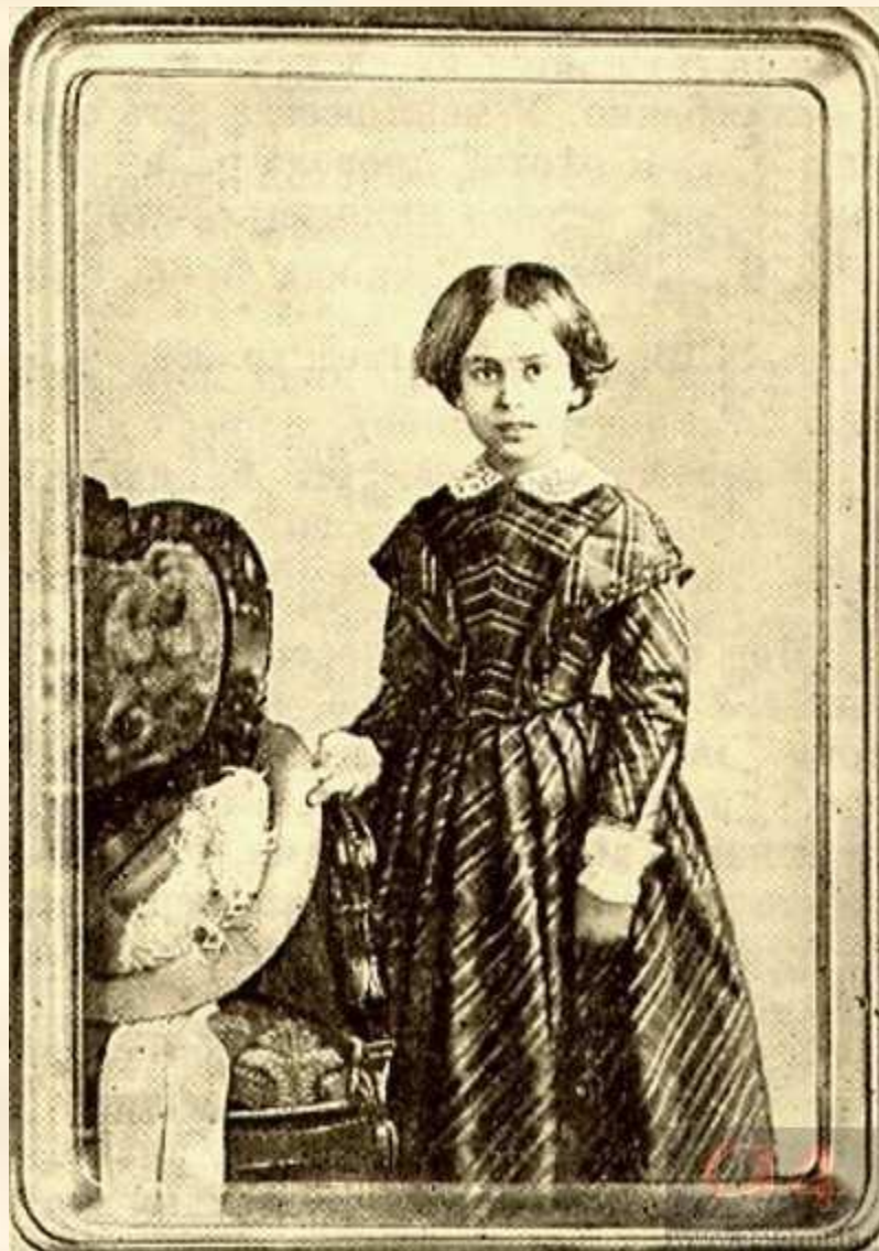
Мария Федоровна Тютчева, дочь поэта. Фото 1848–1849