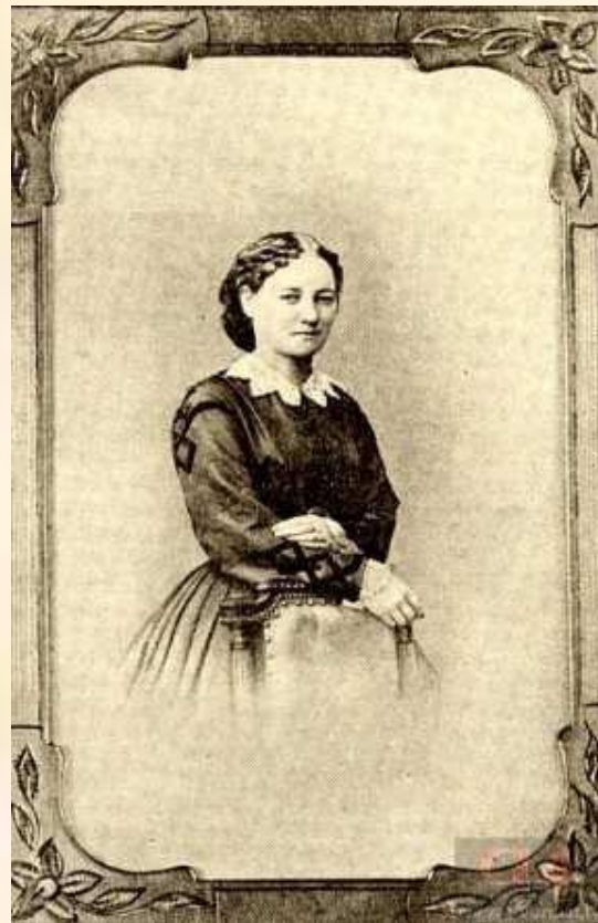
Анна Федоровна Тютчева, дочь поэта. Фото 1865