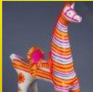
Конь - образ солнца