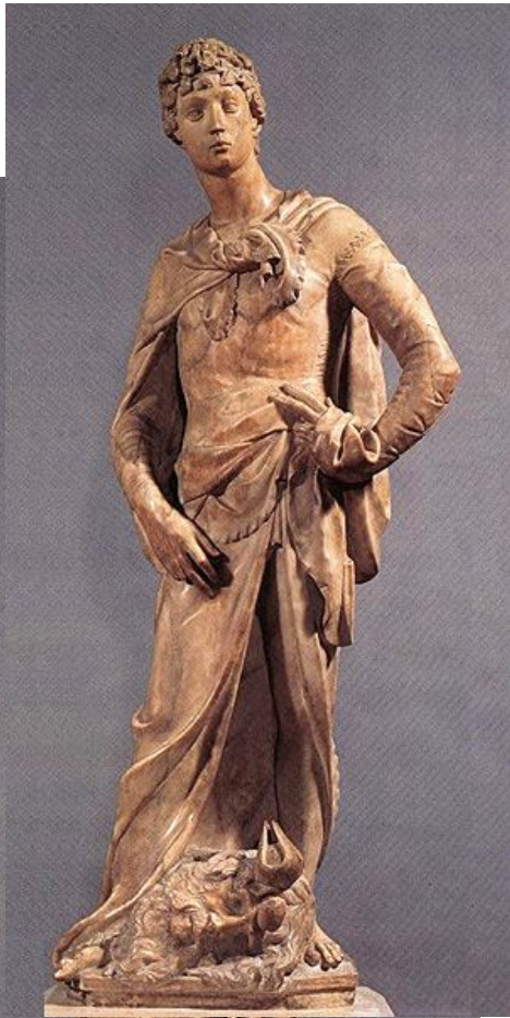
Давид, Мрамор. 1408- 1409.