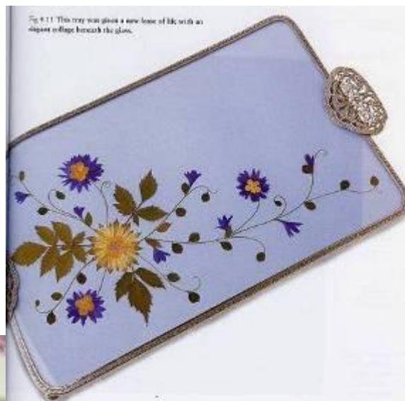
Fig. 4.11 This tray was given a new lease of life with an elegant collage beneath the glass.