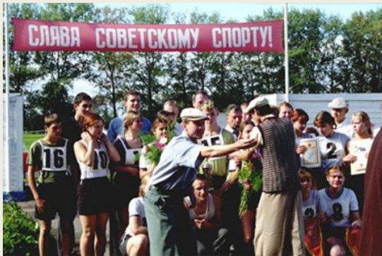
Космос как предчувствие (2005)