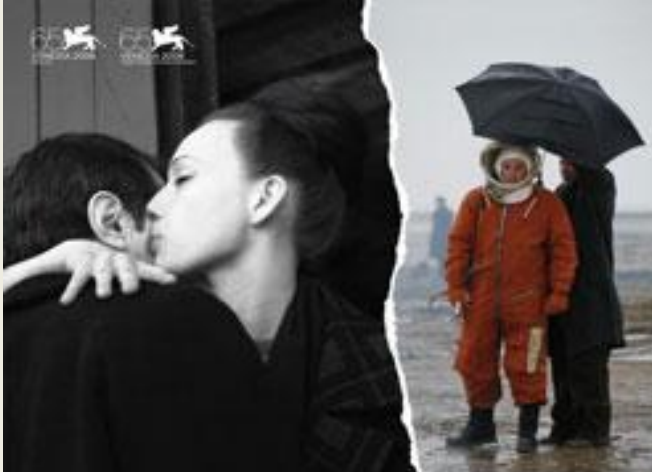
Бумажный солдат (2008)