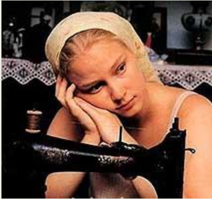
Благословите женщину (2003)