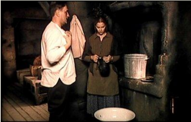
Благословите женщину (2003)