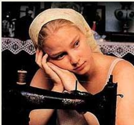
Благословите женщину (2003)