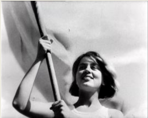
Первые на Луне (2005)