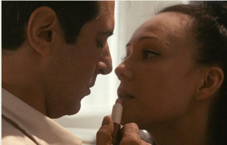
Бумажный солдат (2008)