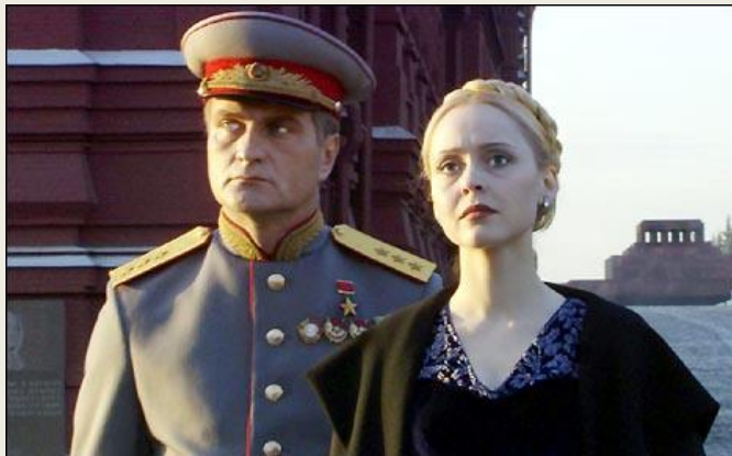
Московская сага (2004)