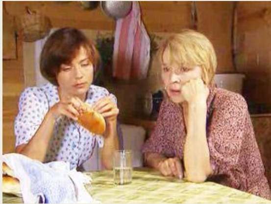
Две судьбы (2003)