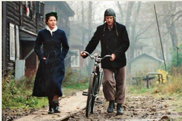
Космос как предчувствие (2005)