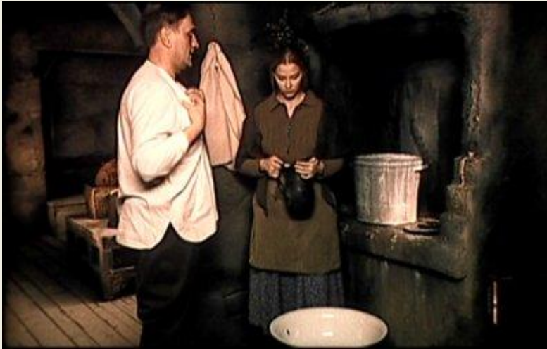
Благословите женщину (2003)