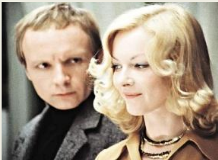
«Ирония судьбы, или с легким паром», реж. Э. Рязанов. 1976 г.