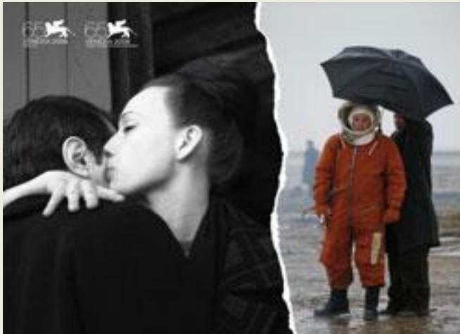
Бумажный солдат (2008)