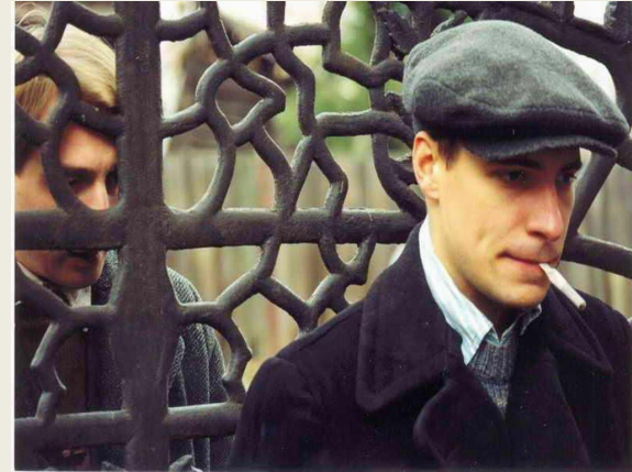
Дети Арбата (2004)