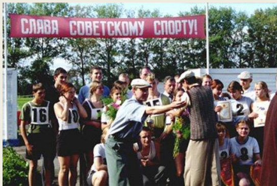
Космос как предчувствие (2005)