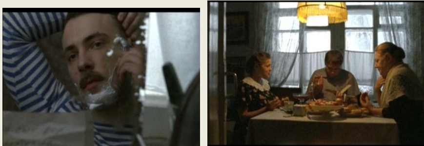
Космос как предчувствие (2005)