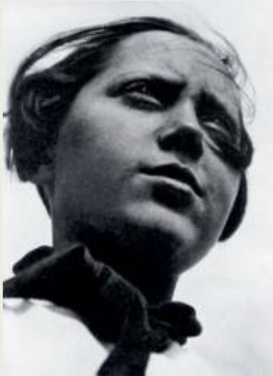
Пионерка, А. Родченко (1930)