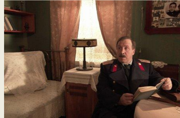
Бумажный солдат (2008)