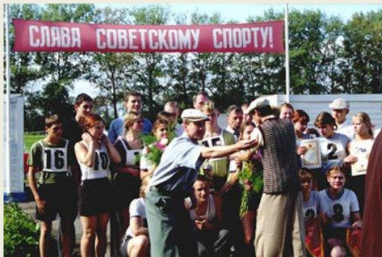
Космос как предчувствие (2005)