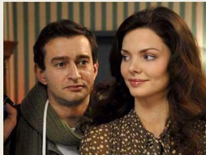
«Ирония судьбы. Продолжение», реж.Т. Бекмамбетов. 2008 год.