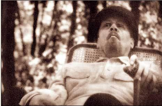
Космос как предчувствие (2005)