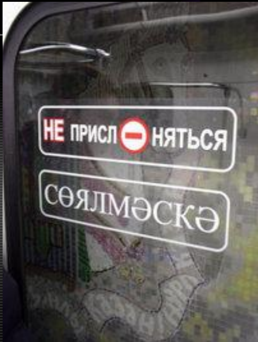
Двухязычный указатель в Казанском метро