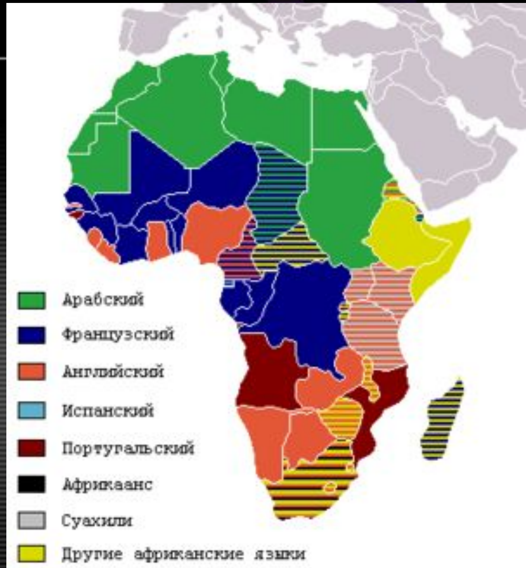
Официальные языки стран Африки

Так, из 55 стран Африки в 21 стране официальным языком считается французский, в том числе в девяти странах — вместе с английским или местным языком; в 19 странах — английский, в том числе в девяти — вместе с местным языком; в 5 странах — португальский.