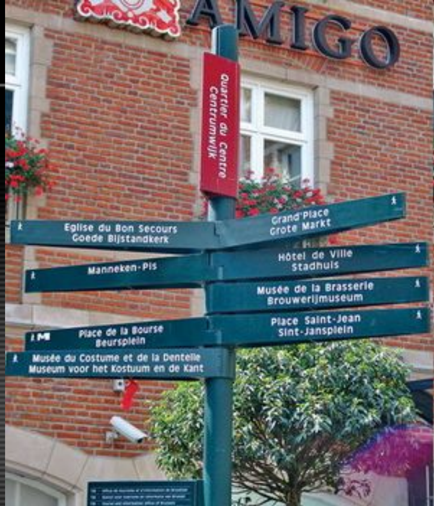
Двуязычные вывески в Бельгии