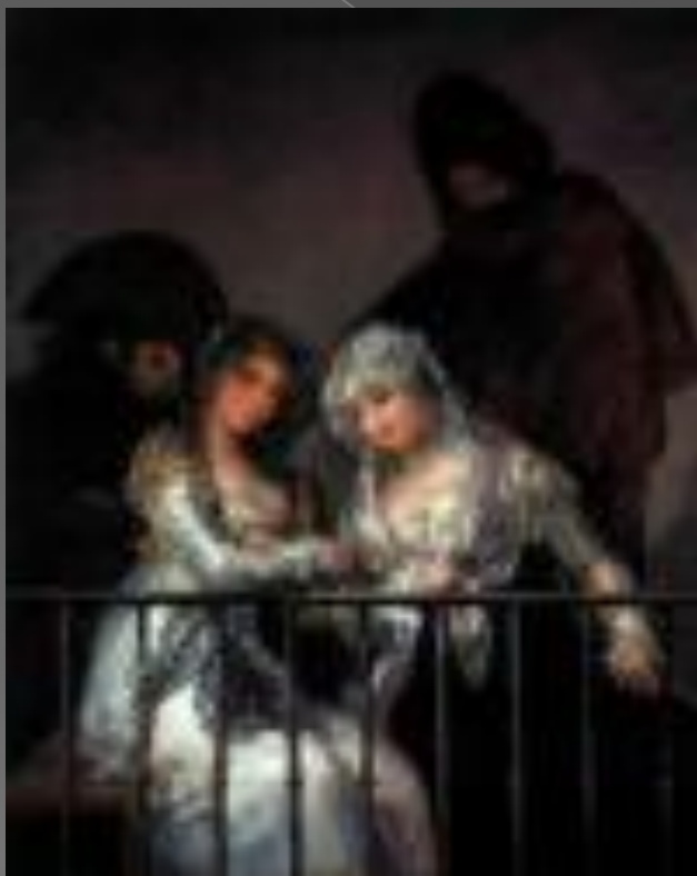
Махи на балконе