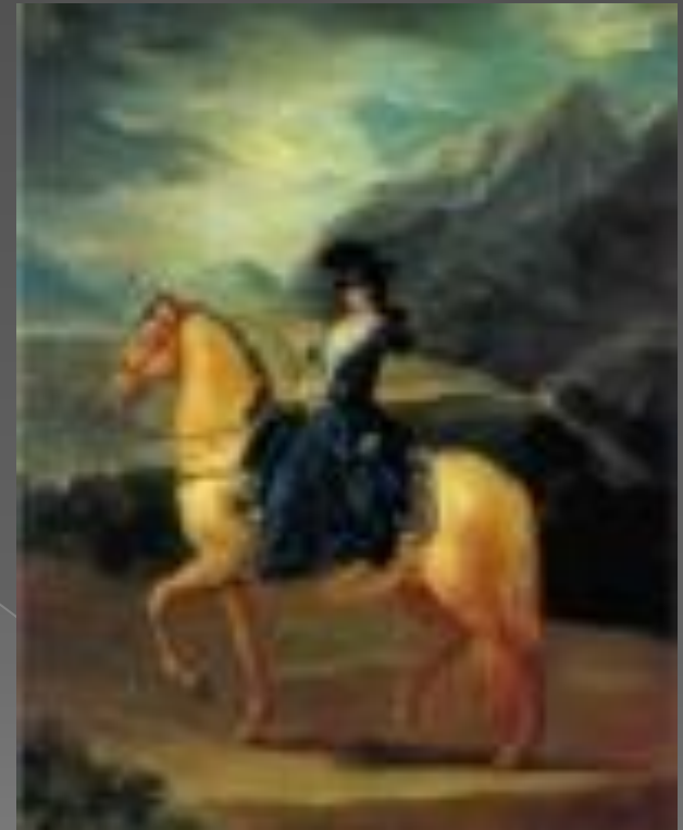
Портрет Мари - Терезы де Валлабриджа