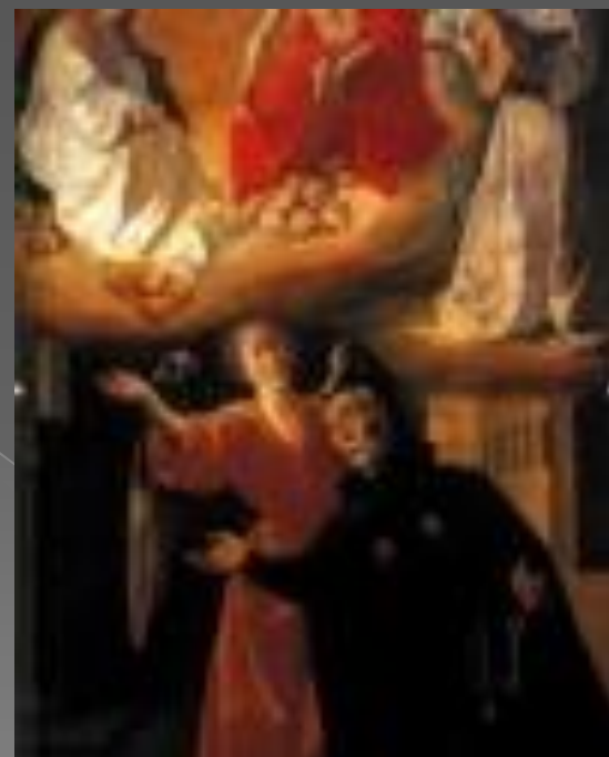
Видение святого альфонса Родригеза