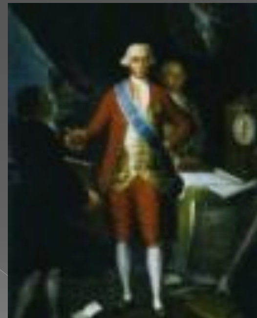
Портрет графа Флоридабланка