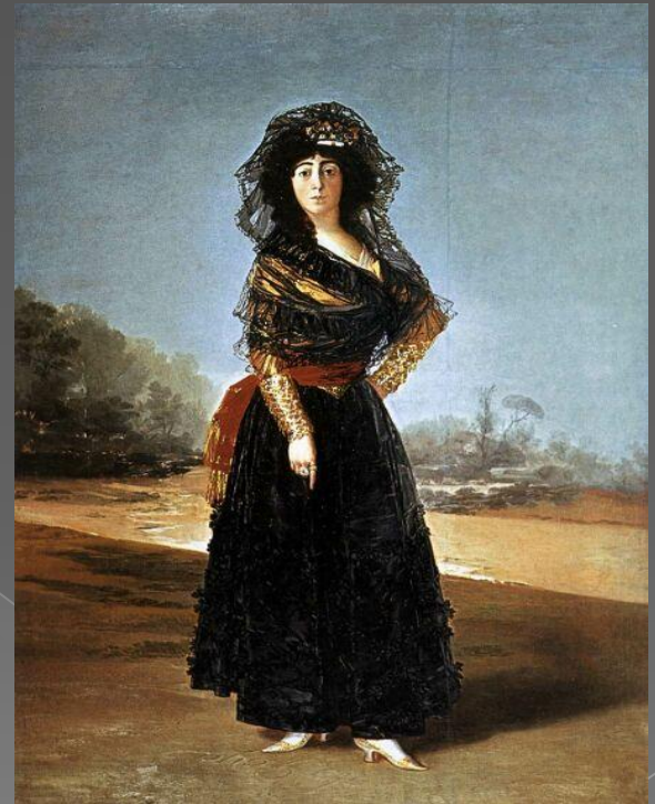
Герцгиня Альба в черном