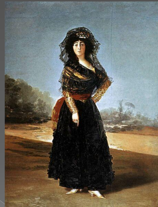
Герцогиня Альба в черном

Кольца на руках герцогини (традиционный символ любовной связи) подписаны именами «Альба» и «Гойя».