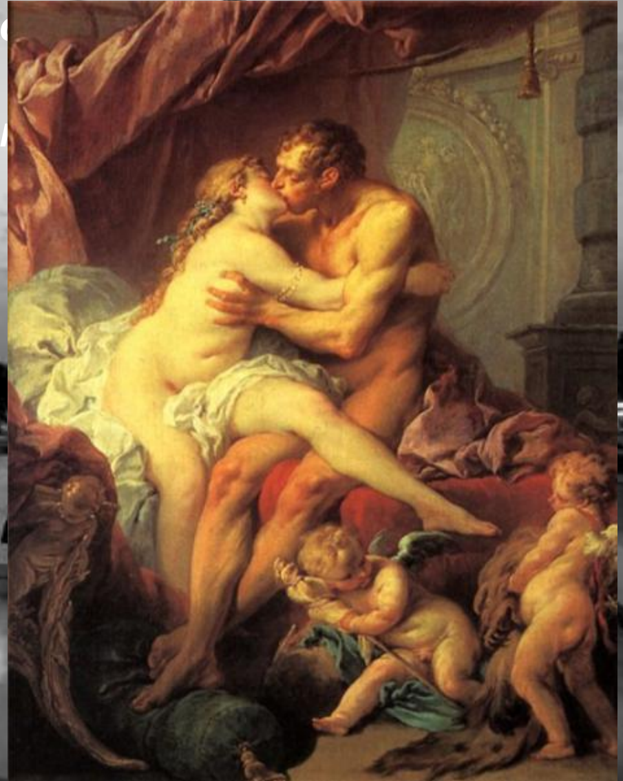
Геркулес и Омфала (1730-е года)

Творчество Буше - как живописца исключительно многогранно. Он обращался к аллегорическим и мифологическим сюжетам