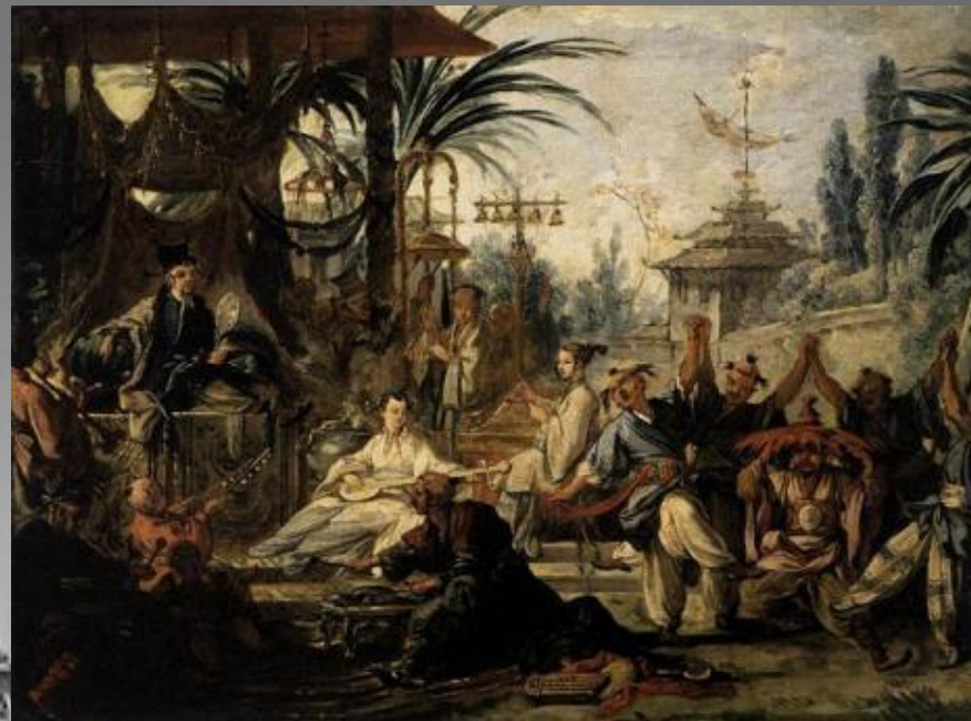
Картина из Китайской серии

Для шпалерной мануфактуры он создал более 40 эскизов для шести серий шпалер («Сельские празднества», «История Психеи», «Китайская серия», «Любовь богов» и др.). Рисунки Буше использовались для украшения фарфора и изготовления фигурок из бисквита с изображением детей и пасторальных сцен («Едоки винограда», «Маленький садовник», «Продавец бубликов», все в Эрмитаже)