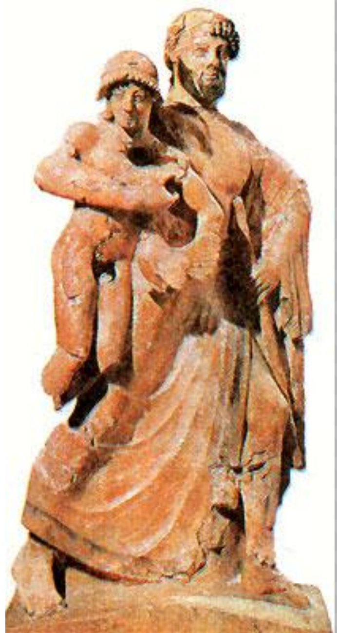
Зевс и Ганимед. Раскрашенная терракота. 470 г. до н. э. Олимпия

Ганимеду, как и обещал Зевс, была дарована вечная юность. Согласно поэтам, на Олимпе он стал любимцем Зевса и виночерпием на пирах богов, сменив на этом посту Гебу. Согласно Аристотелю, боги не пьют вина, и «виночерпий» Зевса, - переносное значение. По Цицерону, он подает богам нектар и амброзию.