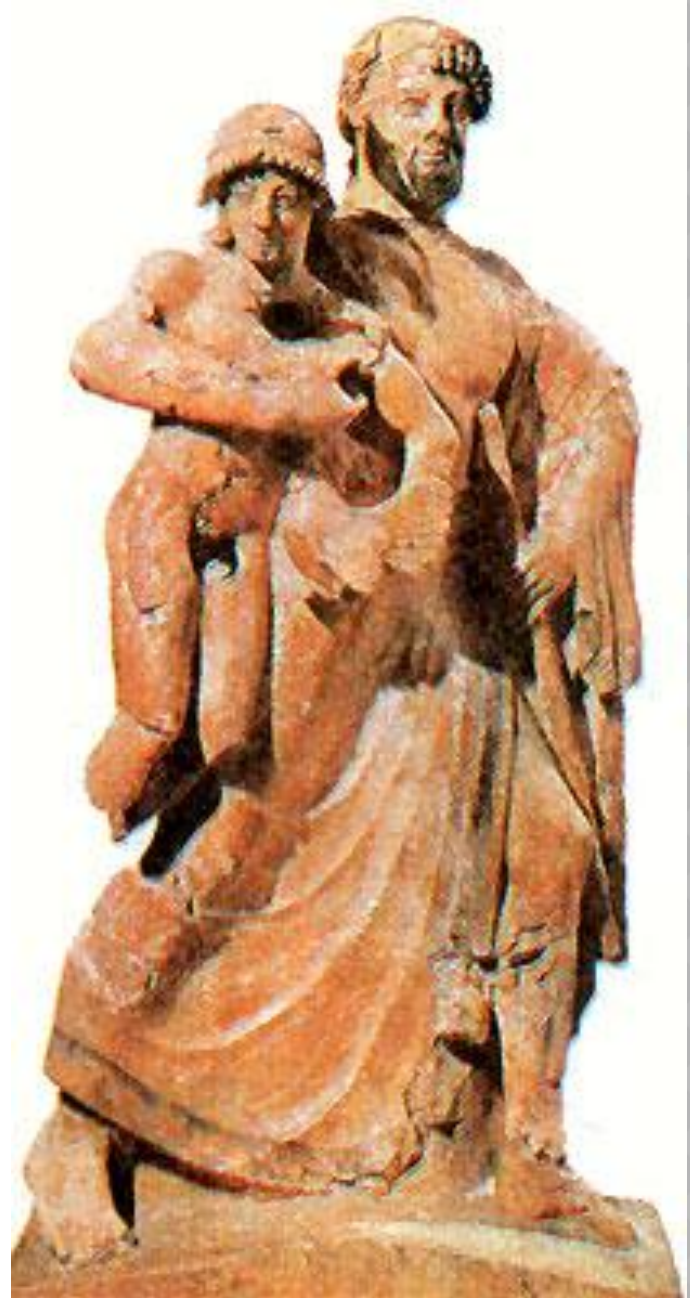
Зевс и Ганимед. Раскрашенная терракота. 470 г. до н. э. Олимпия

Ганимеду, как и обещал Зевс, была дарована вечная юность. Согласно поэтам, на Олимпе он стал любимцем Зевса и виночерпием на пирах богов, сменив на этом посту Гебу. Согласно Аристотелю, боги не пьют вина, и «виночерпий» Зевса, - переносное значение. По Цицерону, он подает богам нектар и амброзию.