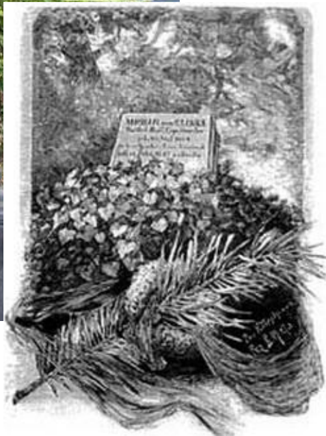
Первоначальный памятник на могиле М. Глинки в Берлине.

Михаил Иванович Глинка скончался 16 февраля 1857 года в Берлине и был похоронен на лютеранском кладбище. На могиле установлен памятник, созданный архитектором А. М. Горностаевым. В настоящее время плита с логилы Глинки в Берлине потеряна. На месте могилы в 1947 году Военной комендатурой советского сектора Берлина был сооружён памятник композитору.