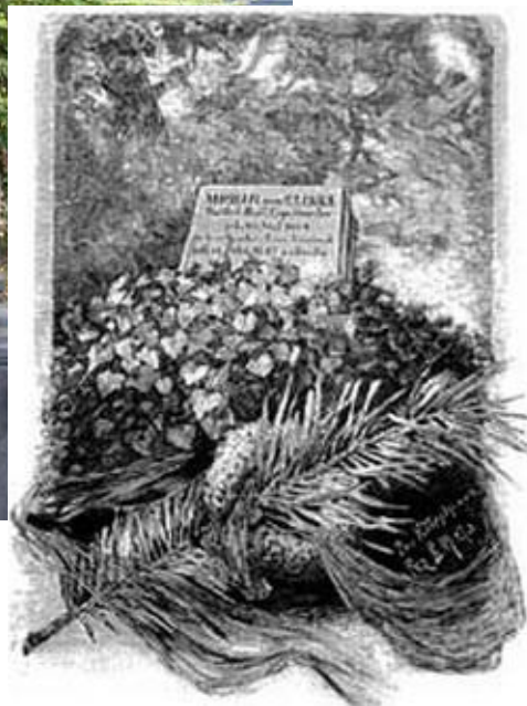
Первоначальный памятник на могиле М. Глинки в Берлине.

Михаил Иванович Глинка скончался 16 февраля 1857 года в Берлине и был похоронен на лютеранском кладбище. На могиле установлен памятник, созданный архитектором А. М. Горностаевым. В настоящее время плита с логилы Глинки в Берлине потеряна. На месте могилы в 1947 году Военной комендатурой советского сектора Берлина был сооружён памятник композитору.