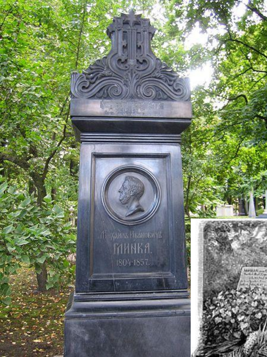
Памятник-надгробие М. И. Глинке на Тихвинском кладбище.