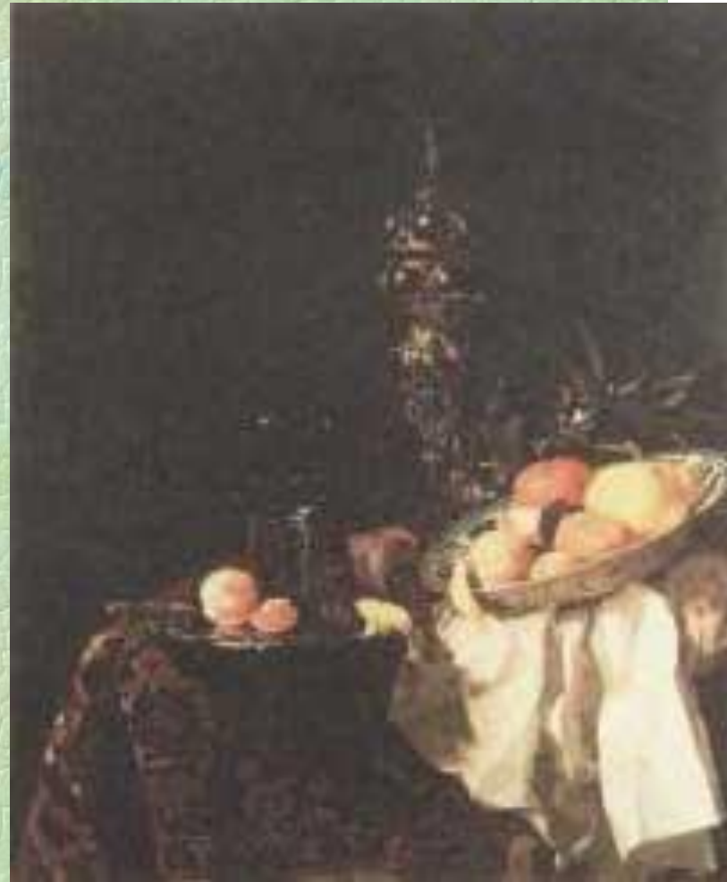
Виллем Калф. Десерт. Ок.1659г.

На картинах Абрахама ван Бейерна и Виллема Калфа изображены грандиозные пирамиды из дорогой посуды и экзотических фруктов.