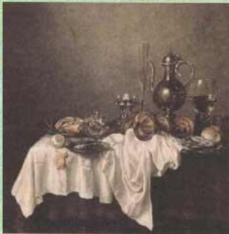
Виллем Клас Хедда. Завтрак с крабом.

В натюрмортах его земляка Виллема Класа Хеды царит живописный беспорядок. Чаше всего он писал «прерванные завтраки». Смятая скатерть, перепутанные предметы сервировки, еда, к которой едва притронулись, — всё здесь напоминает о недавнем присутствии человека. Картины оживлены многообразными световыми пятнами и разноцветными тенями на стекле, металле, полотне.