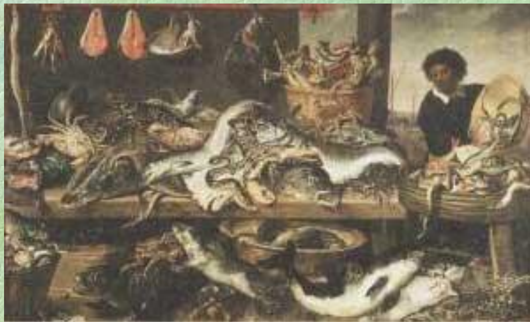
Франс Снейдерс. Фламандская школа. Рыбная лавка.

Его расцвет начался в Голландии, где Реформация, запретив художникам писать картины на религиозные темы, вынудила их искать новые направления.