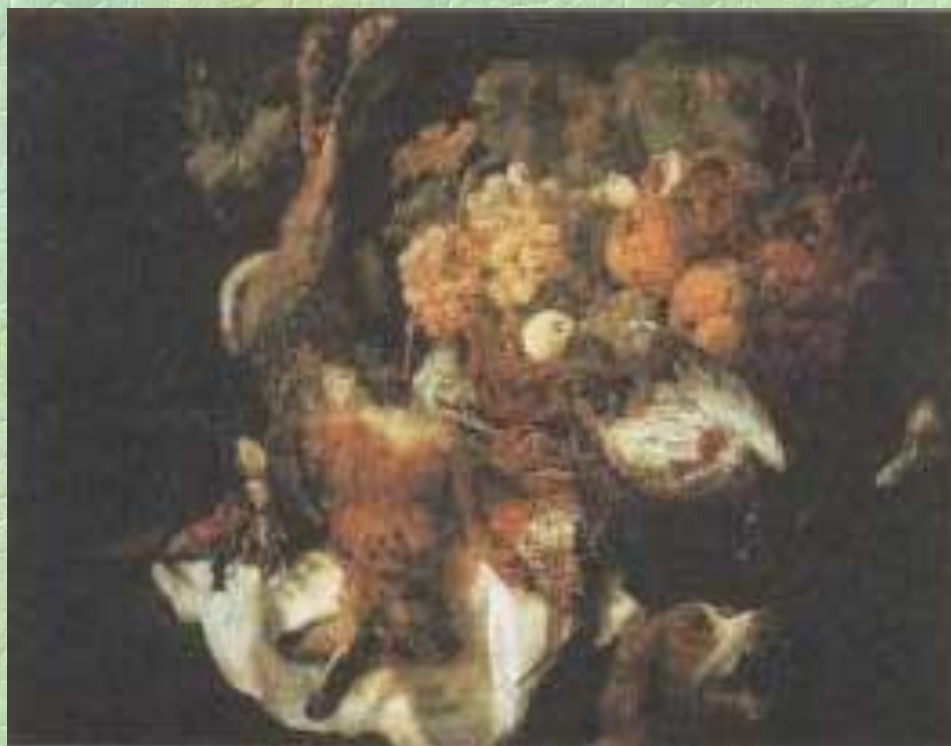
Ян Фейт. Натюрморт с собакой.

Манера фламандского художника Яна Фейта более изысканна, чем у его учителя Снейдерса. Подчёркнуто скромные по композиции и размерам произведения Фейта интересны гармонией сдержанного света, тонких оттенков коричневых, зеленоватых и светло-серых тонов. Это несравненная чуткость живописца сближает его с голландскими мастерами.