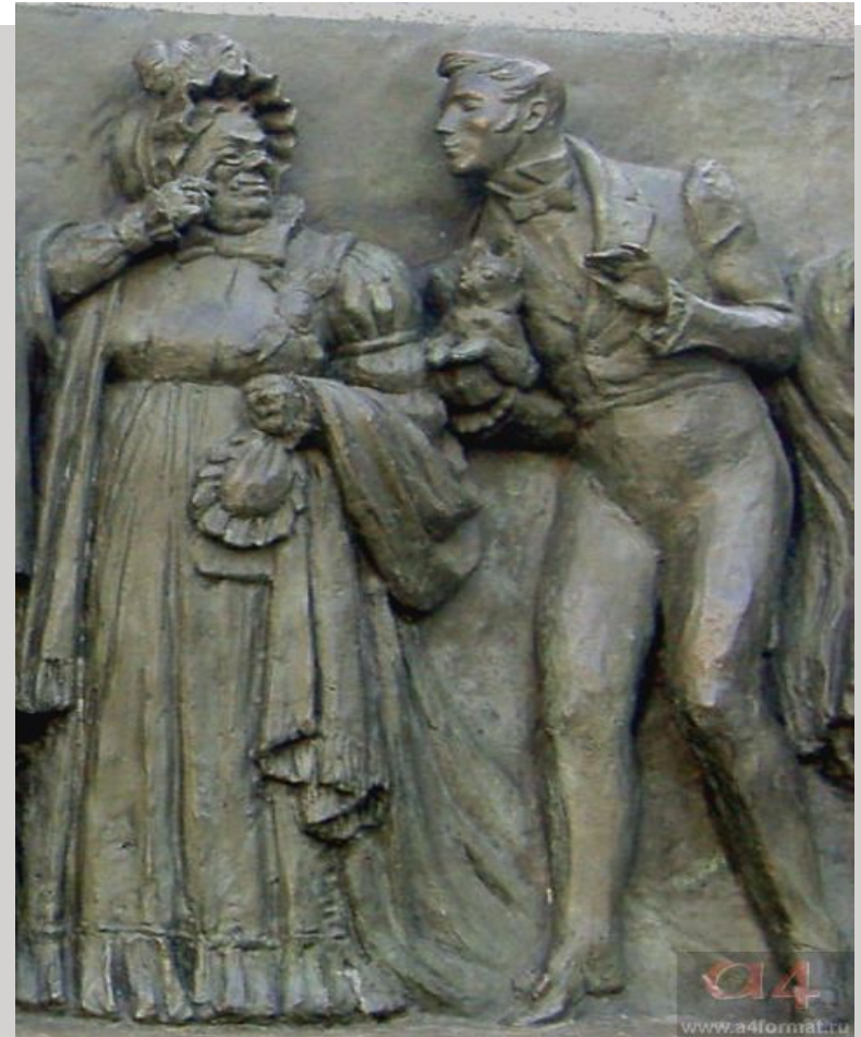
Молчалин и Хлестова