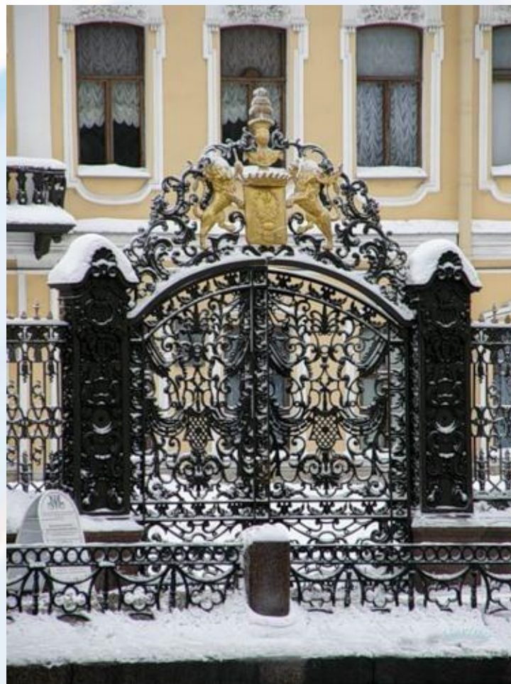
Городские решетки Санкт-Петербурга