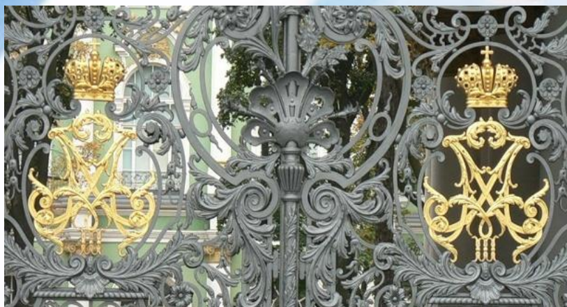
Городские решетки Санкт-Петербурга