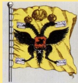
Рисунок судового царского штандарта. ок. 1700 г.