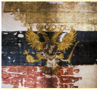
Фото «Флага царя Московского», ок. 1693 г.