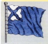
Рисунок флага авангарда с 1700 г.