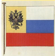
Рисунок флага, высочайше разрешенного к употреблению в частном быту 1914 г.