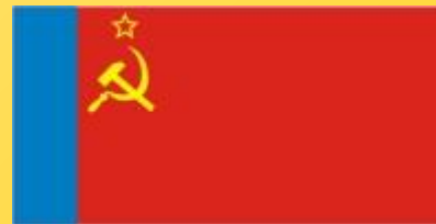
Рисунок флага РСФСР образца 1954 г.