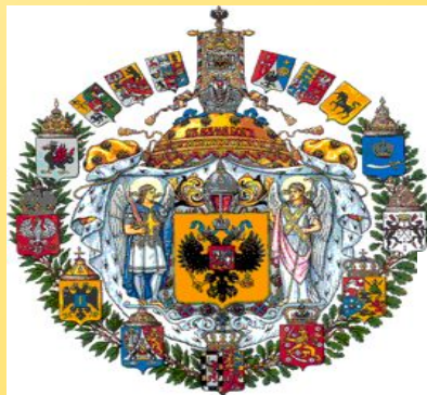
Большой государственный герб Российской империи