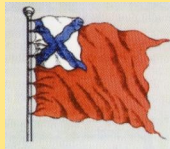
Рисунок флага аръегарда с 1700 г.