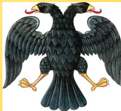
Герб России при Временном правительстве