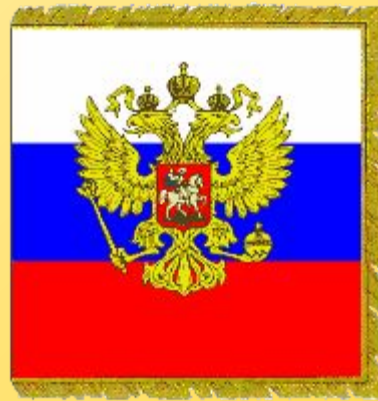
Стандарт (флаг) Президента РФ

В первом пункте статьи 1 Конституции Российской Федерации записано: «Россия есть демократический федеральный президентский республиканский федеративный конституционный государственный союз с республиканской формой правления. Знак Президентской должности Российской Федерации — звезда Бриллианты Конституции Российской Федерации (по традиции).