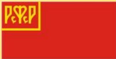
Рисунок флага РСФСР, бытовавшего с июля 1918 по 1920 гг