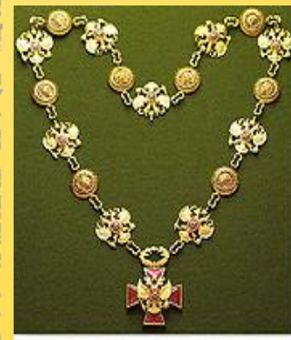
«Полезь, честь и слава»