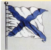
Рисунок флага кордебаталии с 1700 г.