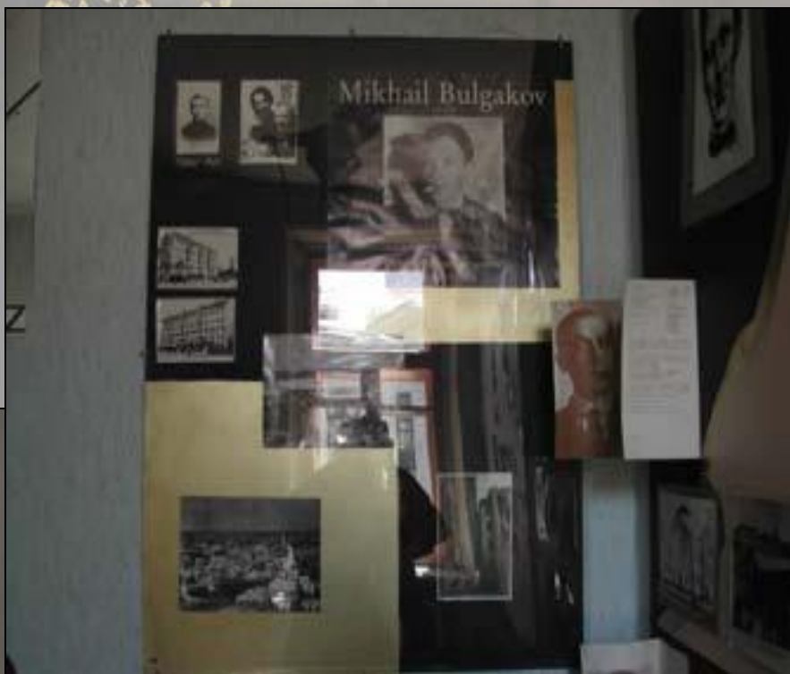
Стенды, посвященные биографии и драматургии Булгакова.