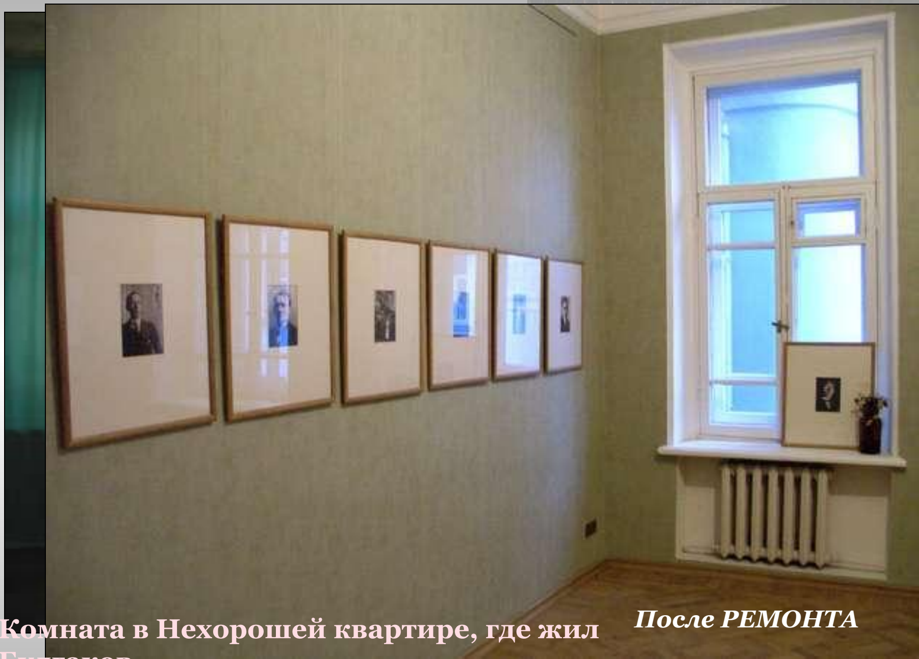
Комната в Нехорошей квартире, где жил Булгаков.