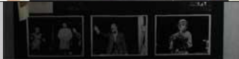
Стенд в первой комнате музея.