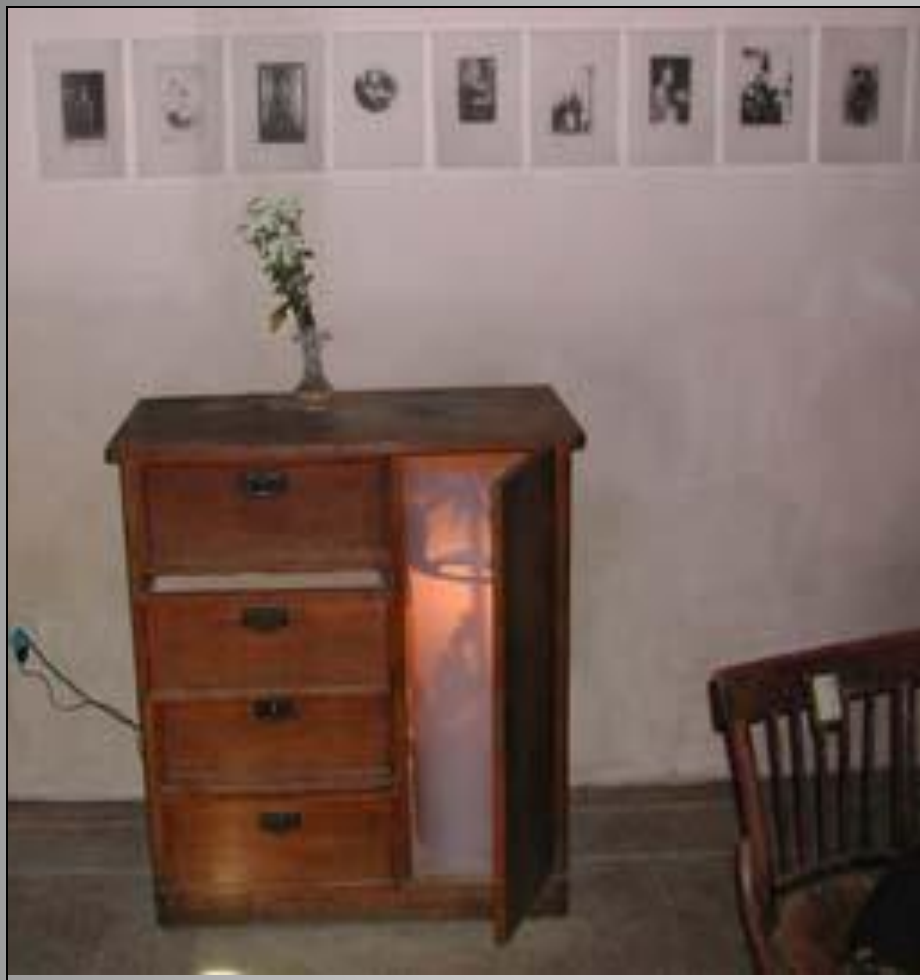
Комод, где рождались картины первой пьесы Булгакова.