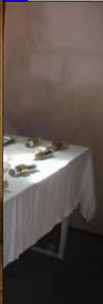
е. На первом плане - свитки с бутылки из-под Аннушкиного растительного масла.