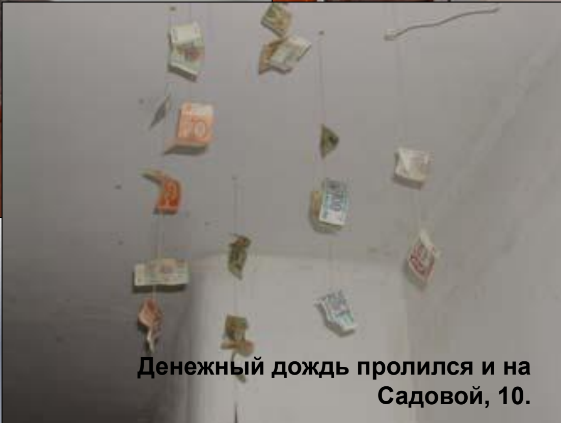
Денежный дождь пролился и на Садовой, 10.