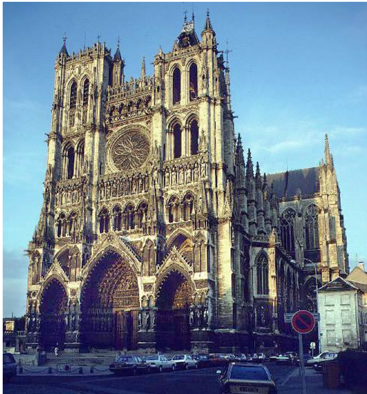
Собор в Амьене