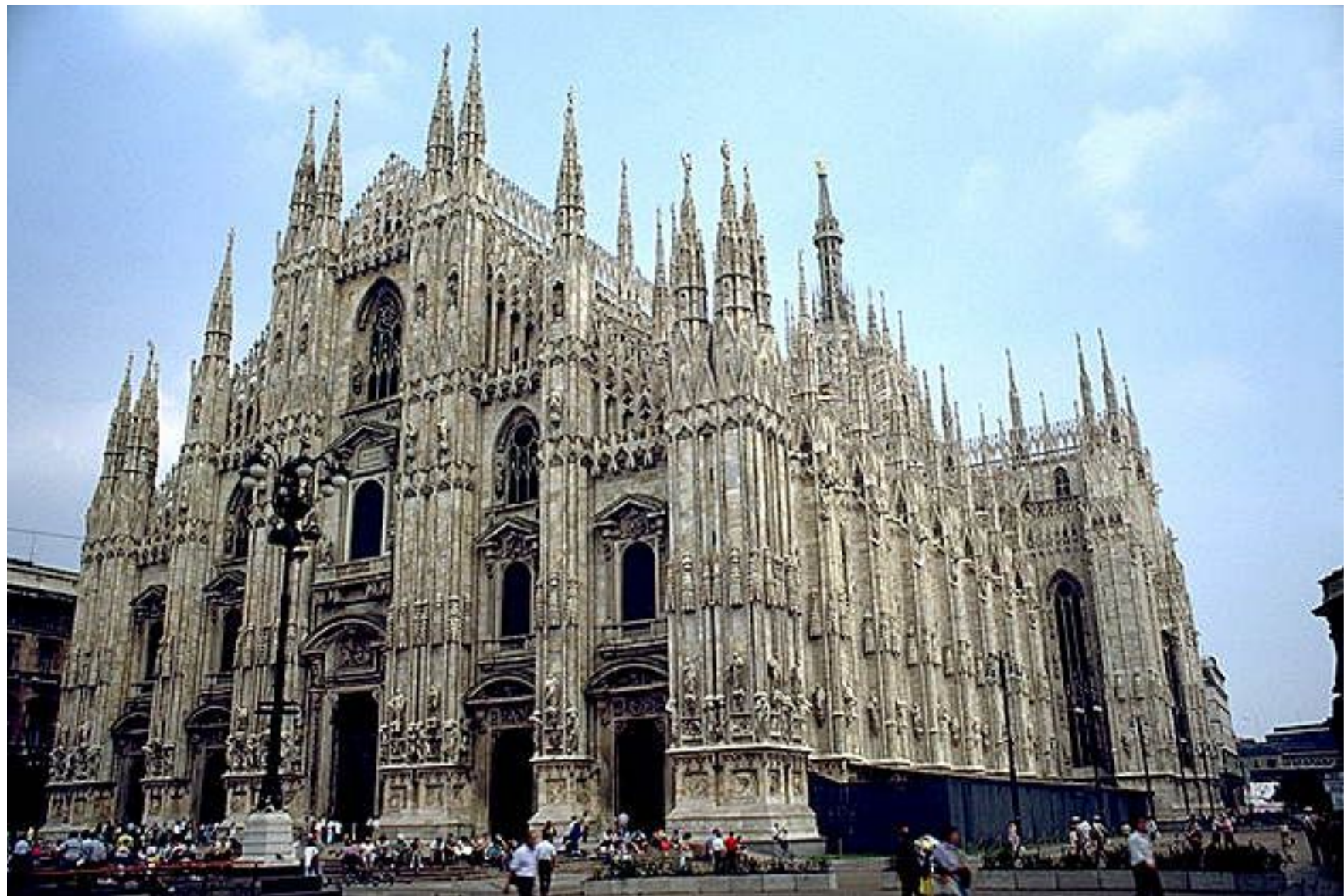
Готический собор в Милане.