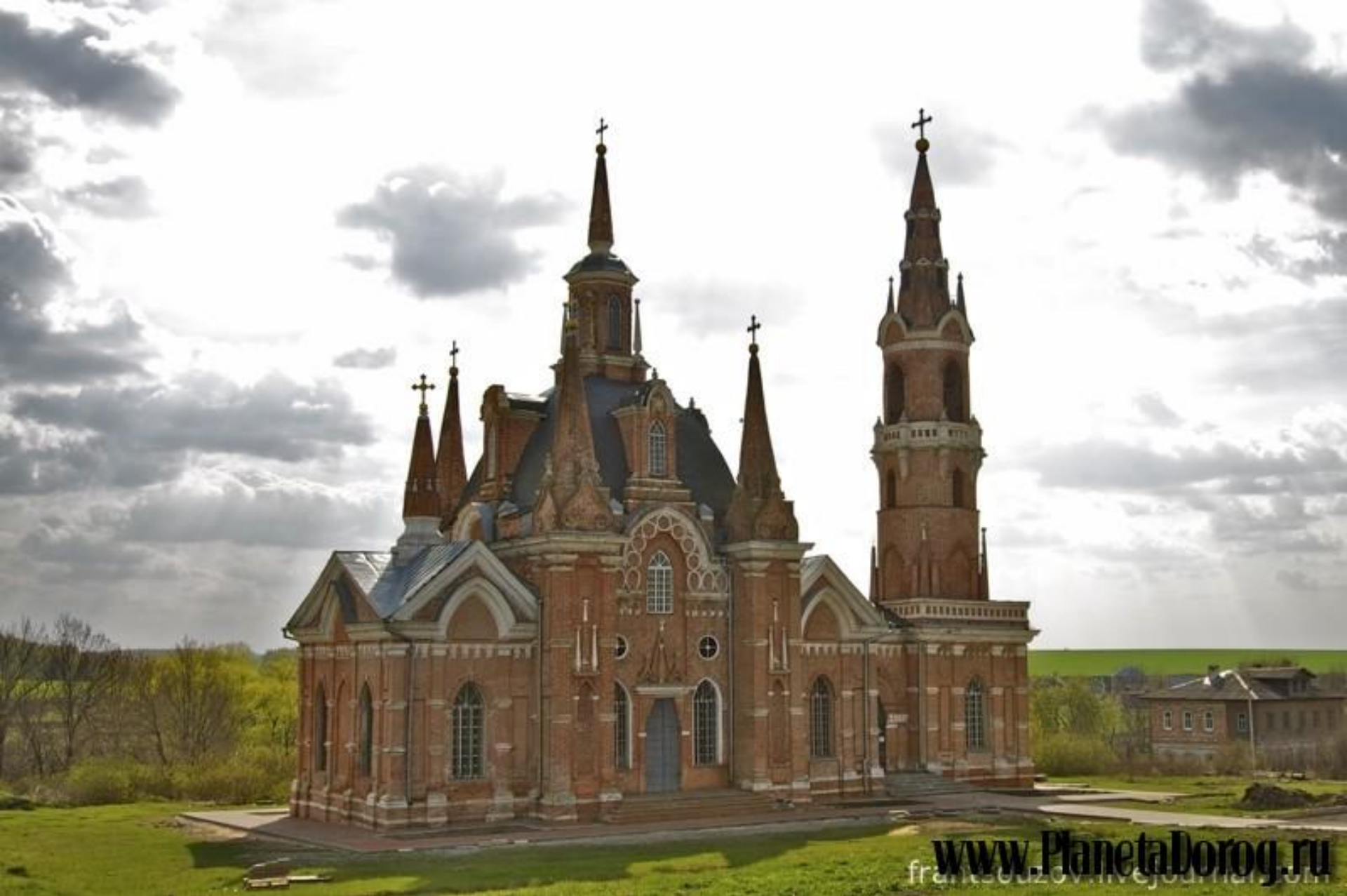
Церковь иконы Знамени Божьей Матери (Знаменская церковь) Липецкая область, село Вешаловка