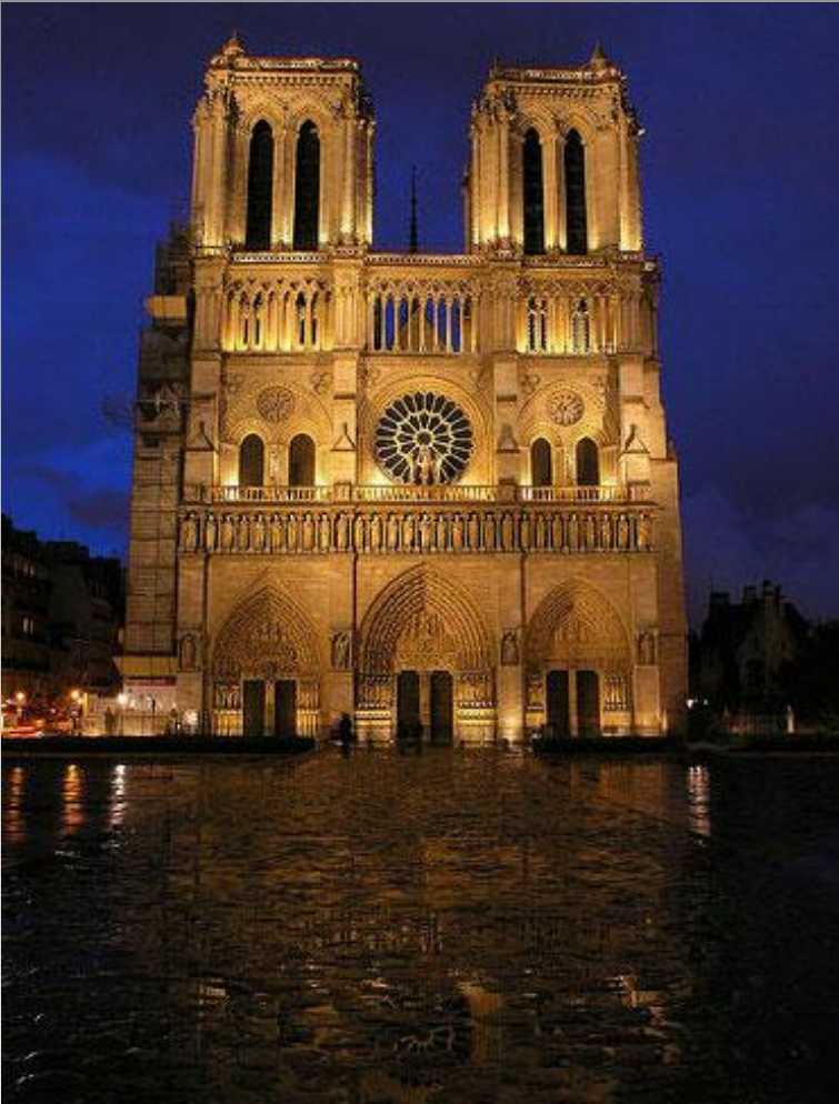
Собор Парижской Богоматери