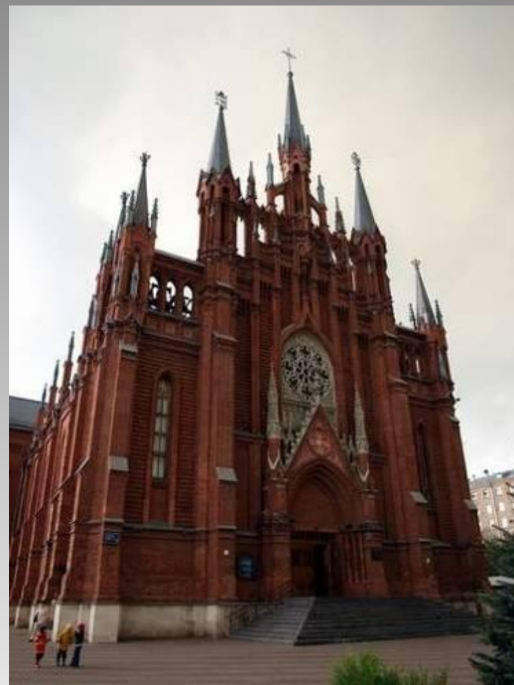
Храм Пресвятого Сердца Иисуса в Самаре