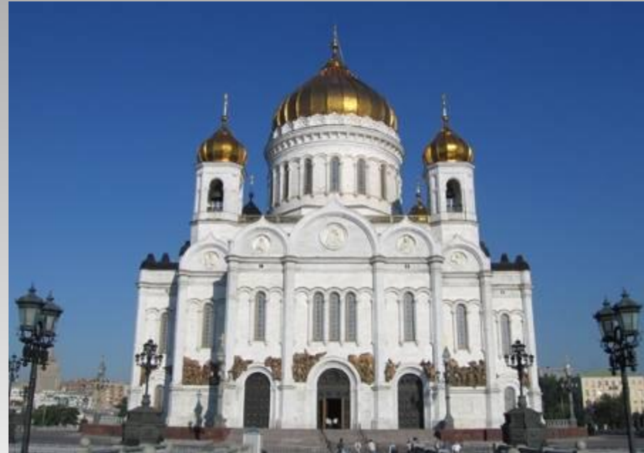
Храм Христа Спасителя

В России строились храмы и соборы крестово-купольного типа.