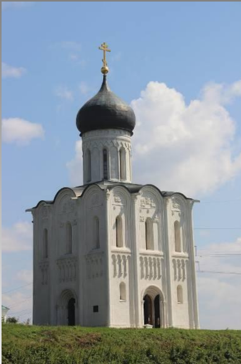
Храм Покрова на Нерли

В Средние века в России, находившейся в сфере влияния византийской цивилизации, готика была неизвестна.