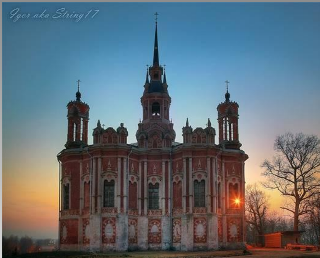
Ново-Никольский собор в Можайске