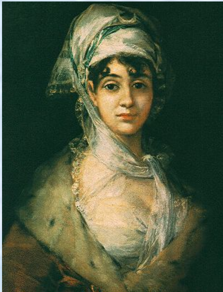
Портрет Антонии Сарате