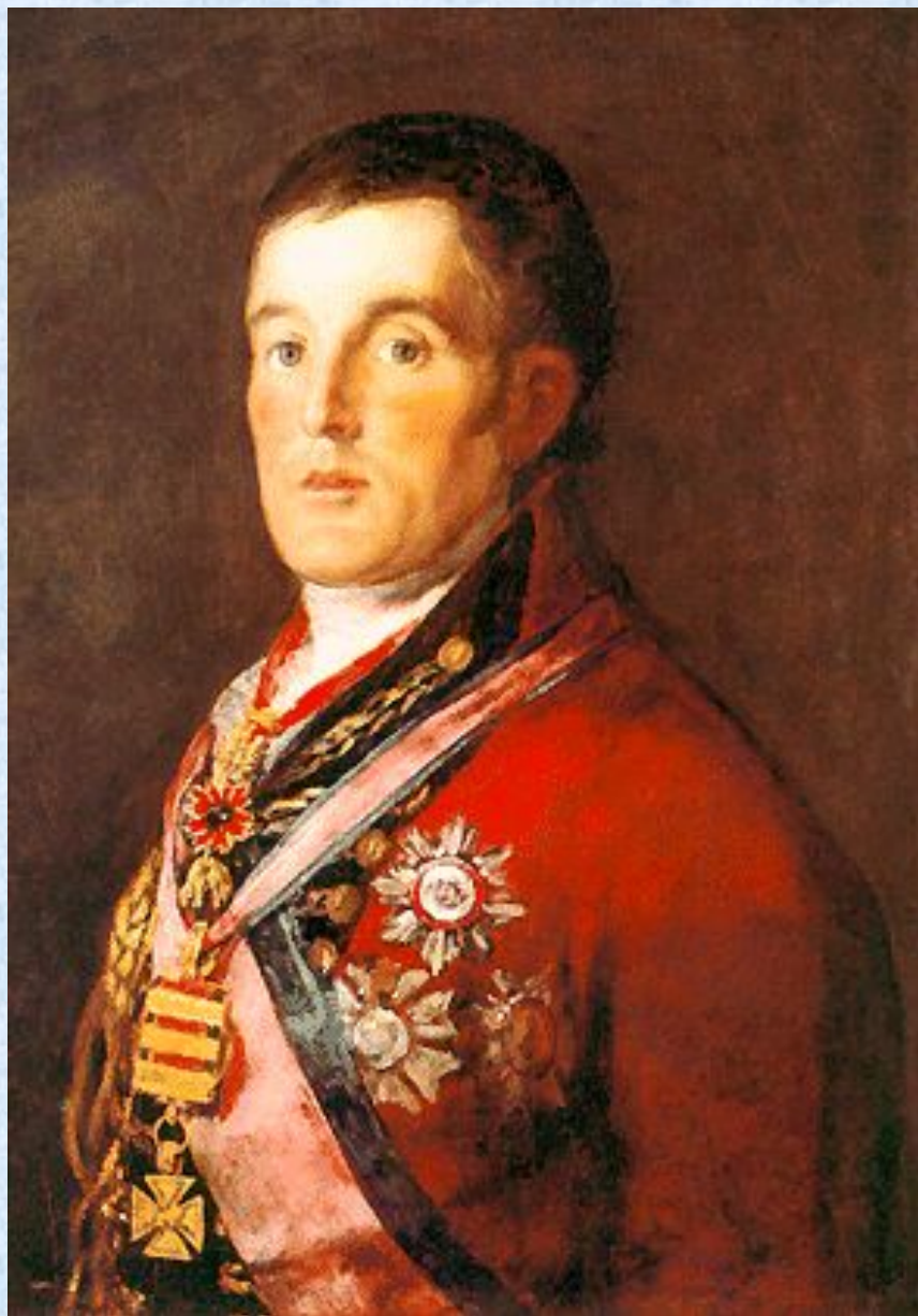
Портрет герцога Веллингтона