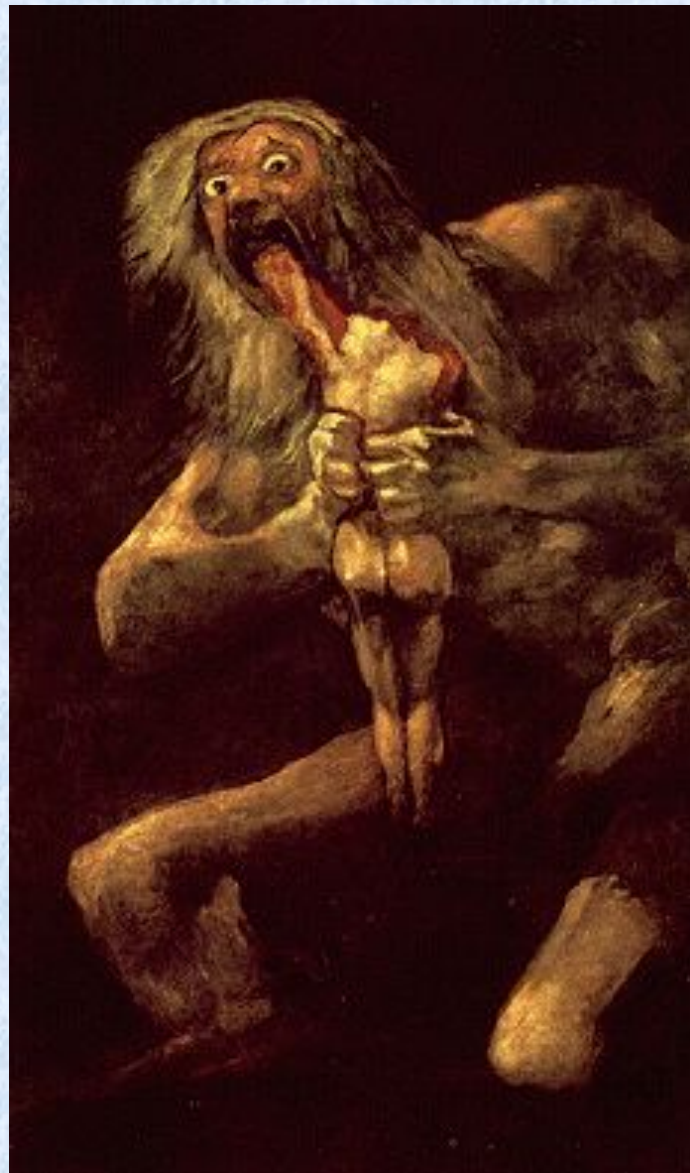
Сатурн, пожирающий своих детей