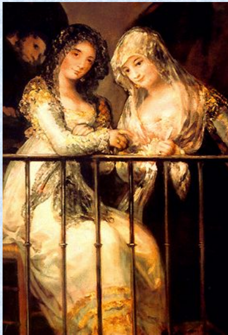
Махи на балконе