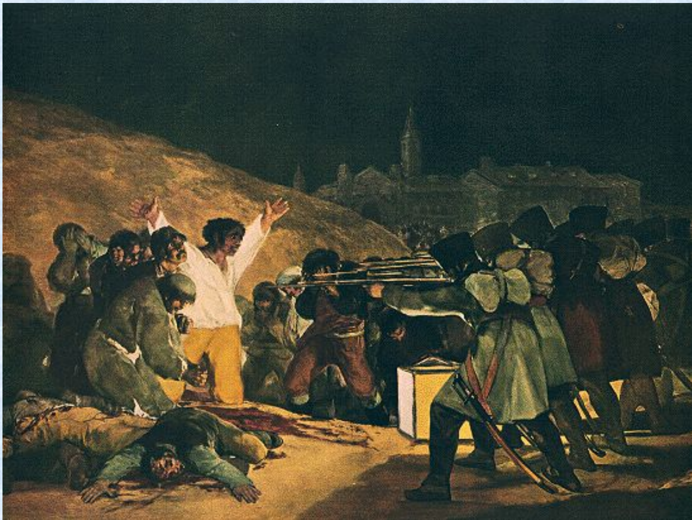
Расстрел повстанцев в ночь на 3 мая 1808 года