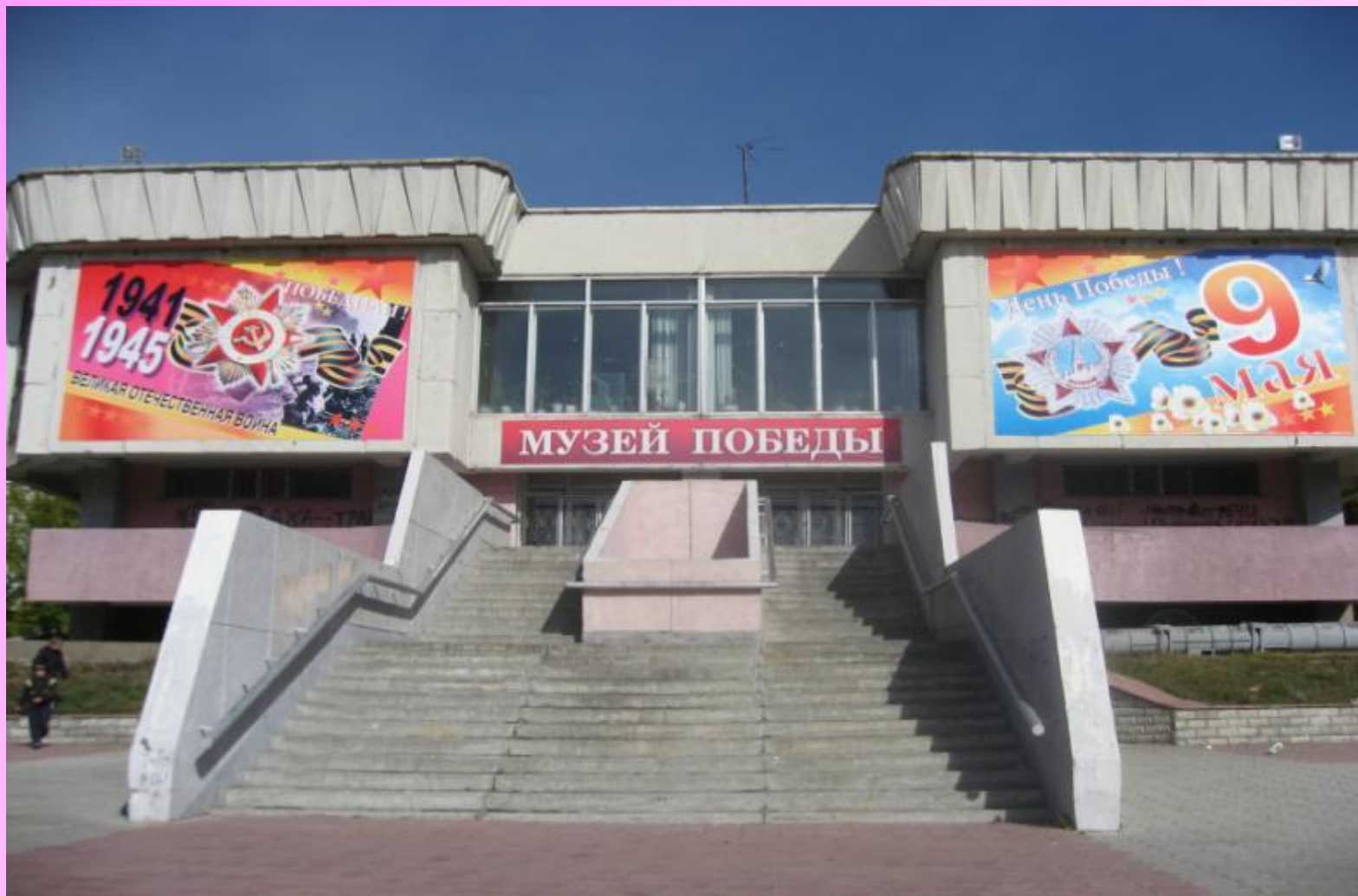
Музей Победы г. Ангарск.