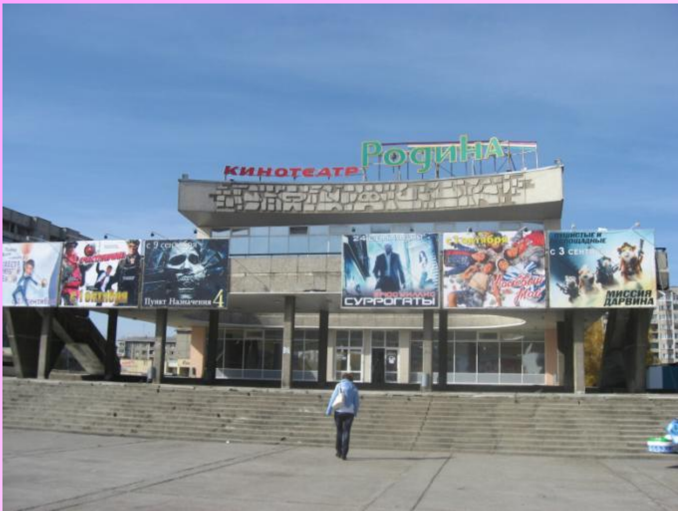
Кинотеатр «Родина» г. Ангарск