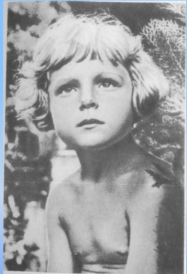
Гуле 3 года