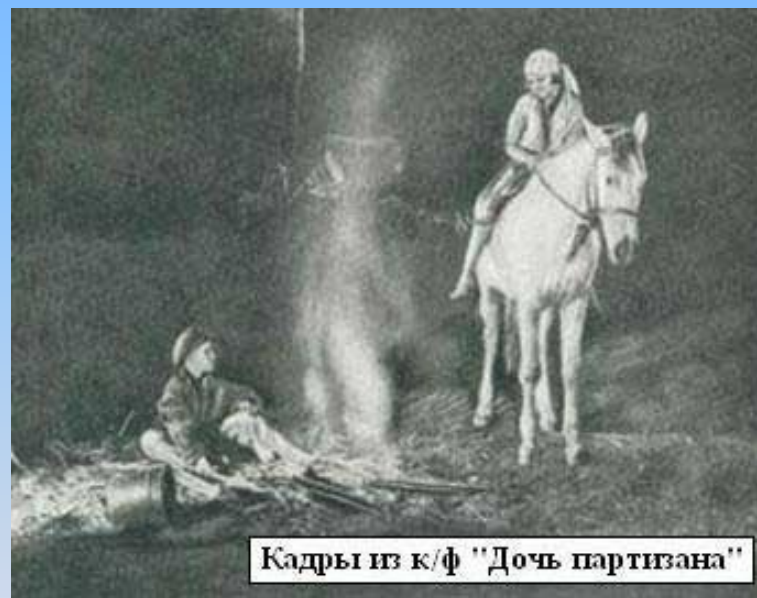
Кадры из к/ф "Дочь партизана"